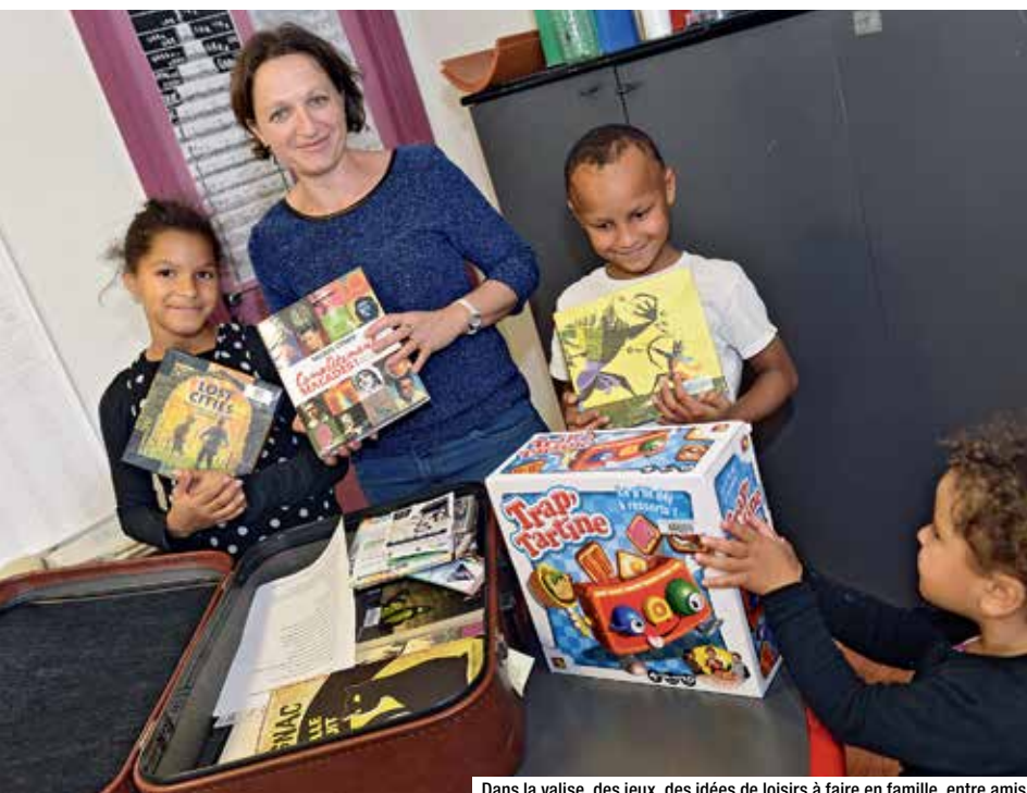
Dans la valise, des jeux, des idées de loisirs à faire en famille, entre amis