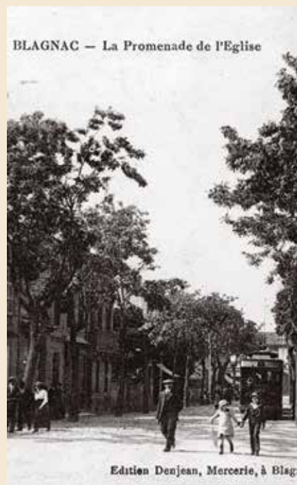
Edition Denjean, Mercerie, à Blagnac