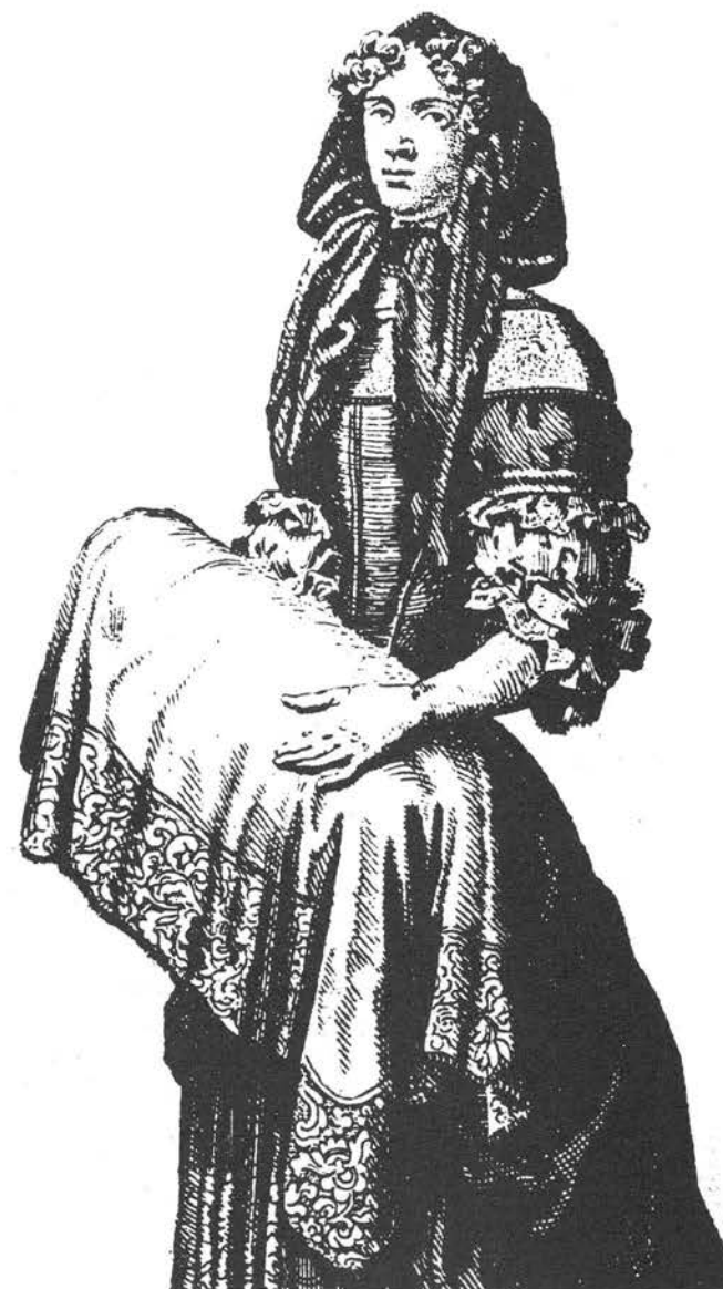
Sûrement, une sage-femme de la Ville...

L'enfant ainsi nettoyé, baigné (il ne le sera pas de sitôt : la crasse étant synonyme de vie), habillé est prêt pour un acte essentiel : le baptême ou deuxième naissance.