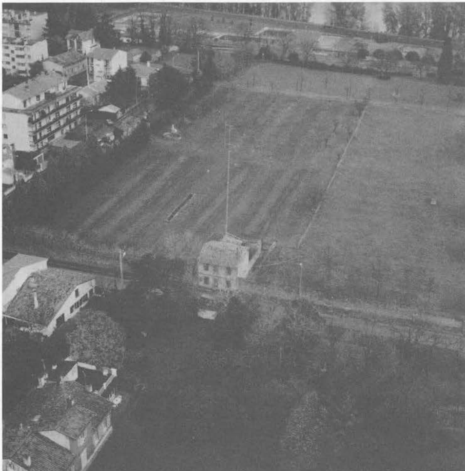
Les jardins du château et le mur de clôture que longe l'avenue du Général Compans tracée au début du XIX e siècle.