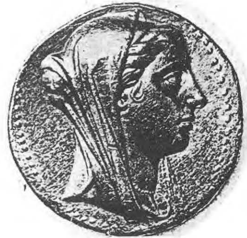
6- Bérénice 246-221 av. J.C.