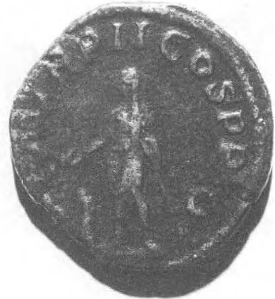
Gordianus - 238-244 ap. J.C.