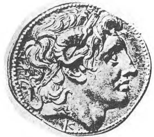
3- Alexandre 323-305 av. J.C.