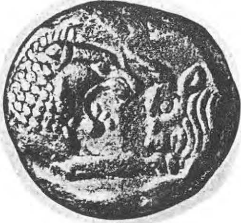
1- Crésus 560-546 av. J.C.