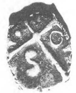
Monnaie Gauloise "à la croix" - type négroïde