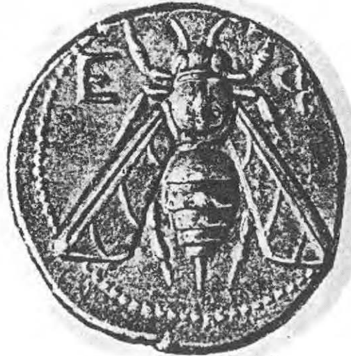
5- Ephèse 374-340 av. J.C.