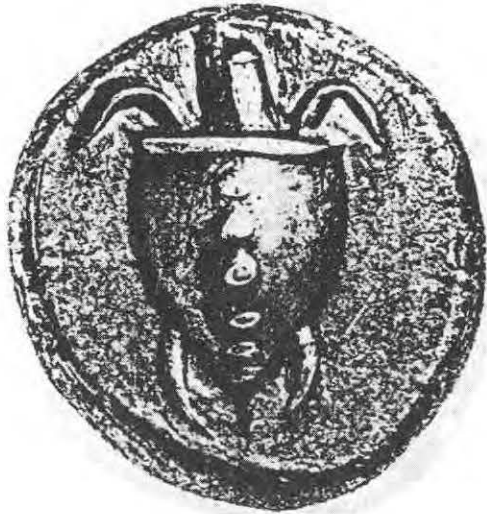
4- Egeine 540-520 av. J.C.