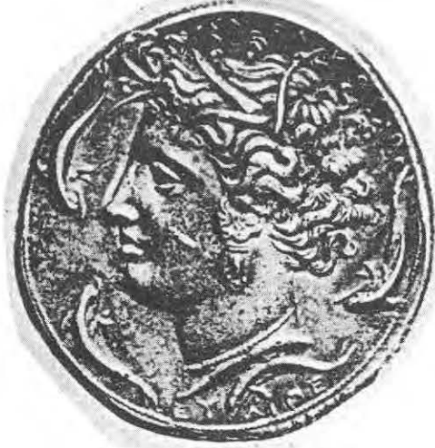
2- Syracuse 422 av. J.C.