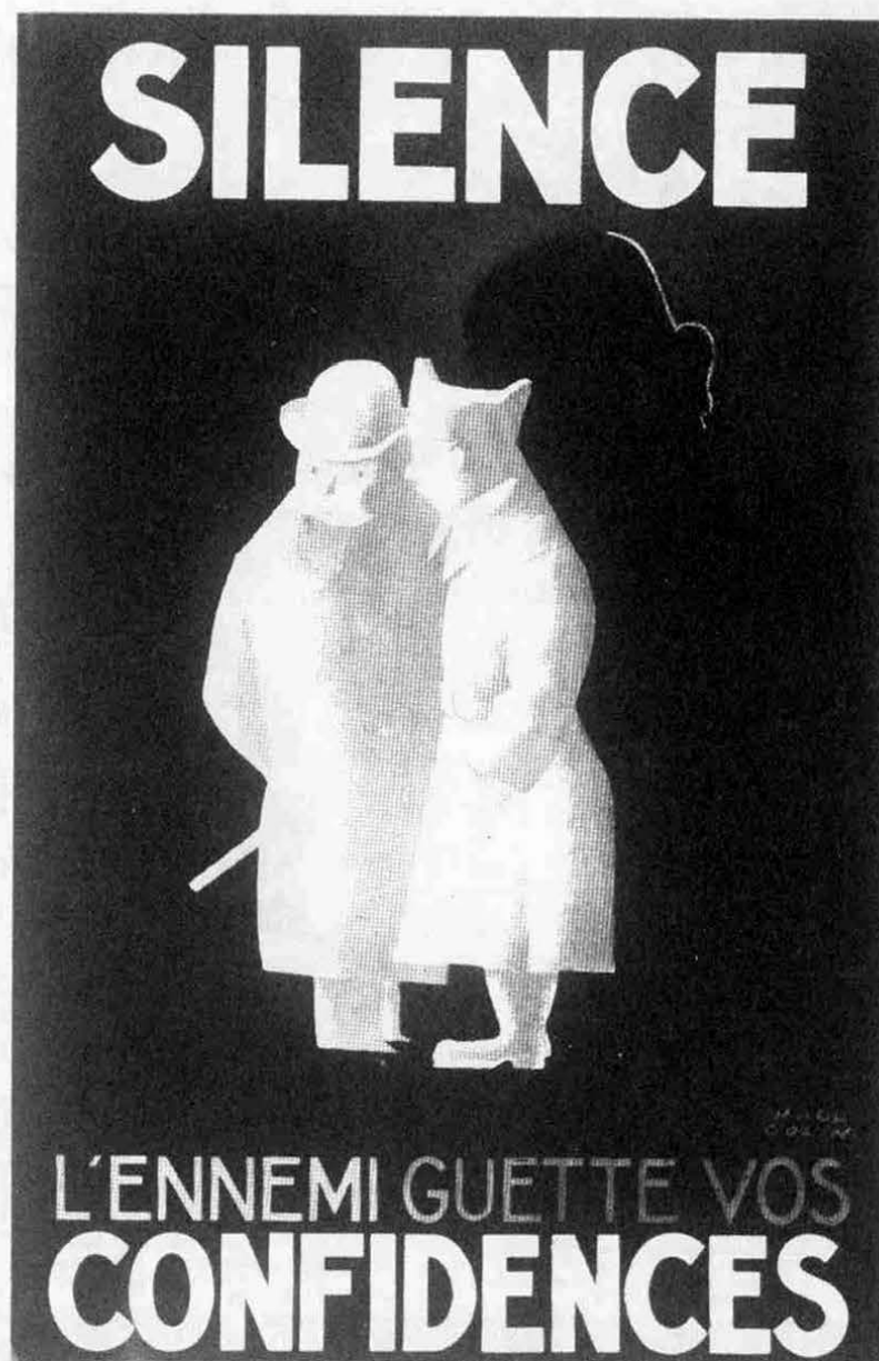
Affiche de février 1940, signée Paul Colin, format 59 x 38,5.

Auch au 214 o , soit au 220 o à Saint-Gaudens. Certains étaient aussi au 117 o régiment d'artillerie à Toulouse. Ils sont acheminés sur les divers points de la bataille annoncée. Ils racontent leurs périples à travers le pays.