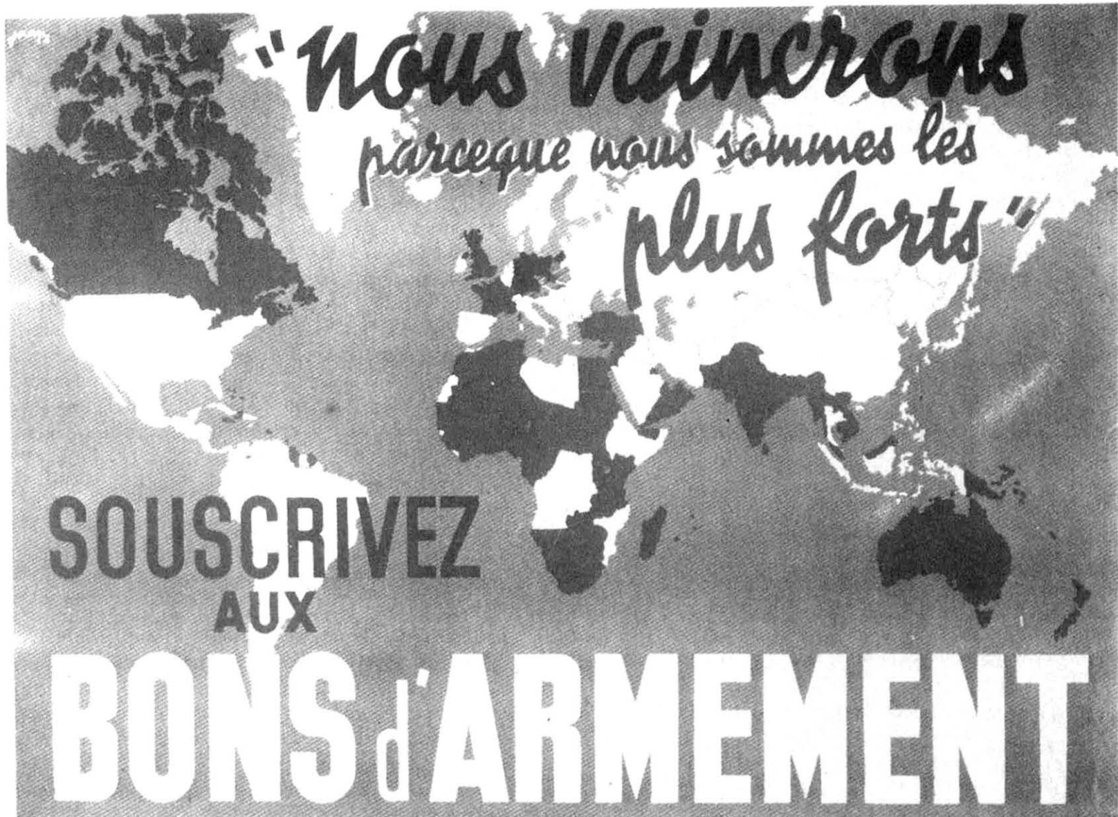
Affiche pour la souscription aux Bons d'armement, reproduisant la fameuse phrase de Paul Reynaud: «Nous vaincrons parce que nous sommes les plus forts», 1940, 59 x 80.