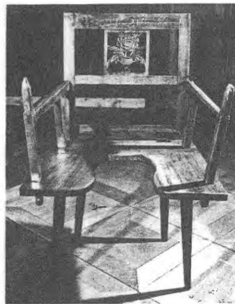
Chaise d'accouchement. Décorée, datée (1837) et marquée aux initiales de la sage-femme alsacienne qui l'utilisait ; ce modèle pliant était aisément transportable, Musée alsacien, Strasbourg.