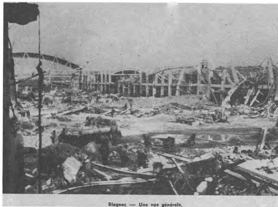
Blagnac — Une vue générale.

bombes troublèrent une première communion, tandis que 11 immeubles étaient brûlés et 19 en partie détruits par le souffle. (Note n° 3)