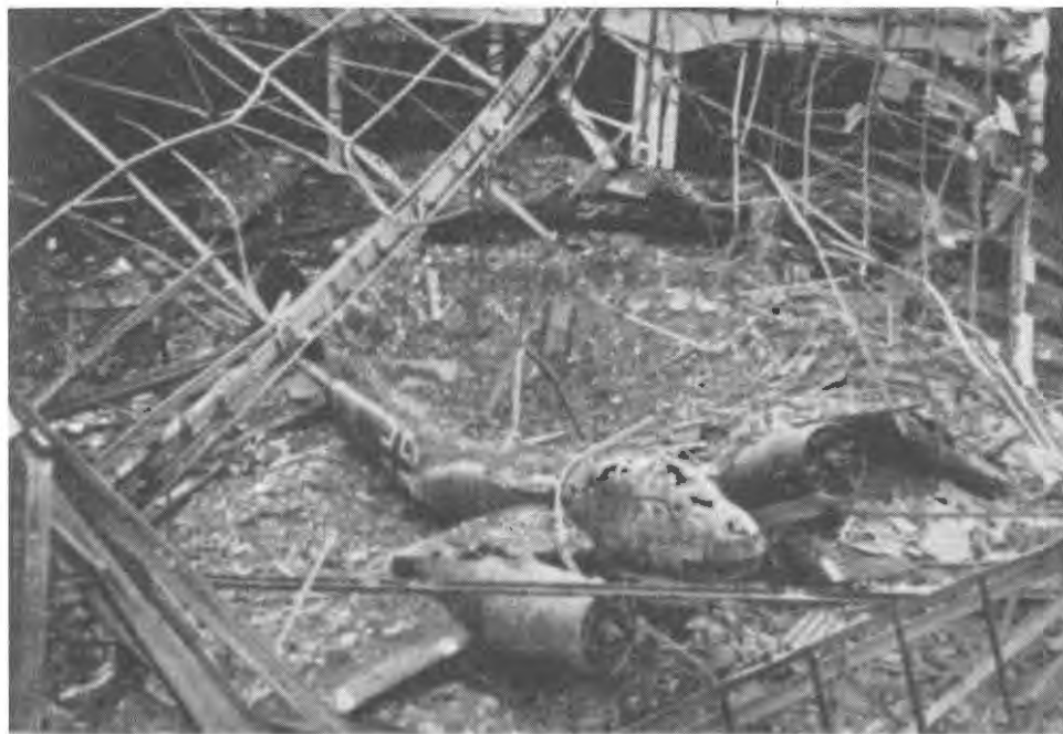
Bombardement du 2 mai 1944 Saint-Martin-du-Touch : Mouche ! !

Il n'intéressa pas directement Blagnac, les objectifs étant la gare, la Poudrerie, l'Office National Industriel de l'Azote (O.N.I.A.), l'Arsenal, et les usines de Saint Martin du Touch. Signal de danger aérien donné à 0 h 35, alerte donnée à 0 h 50 : une centaine d'appareils en sept vagues successives, volant entre 1200 et 1500 m d'altitude, probablement de la R.A.F., la 1ère vague envoyant ses fusées éclairantes, est prise à partie par la "FLAK". Le bombardement ne débute qu'à 1 h 15, ayant donc permis la fuite vers les abris, et dure 45 minutes, comme au 6 avril. Bombes explosives, dont certaines de 1000 et 2000 kg, mais surtout de 250 et 500 kg, incendiaires aussi nombreuses, dont certaines au phosphore.