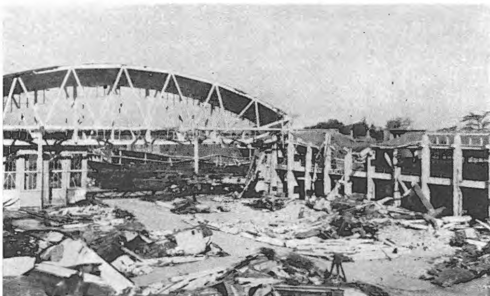
Blagnac — Au centre de la photo des débris d'avions calcinés.

de l'Angleterre. Ils atteignirent la côte normande entre 07 h et 08 h, Albi à 08 h 50, où ils se divisèrent entre ceux qui allaient à Montbartier et ceux qui se dirigeaient vers Franczal qui fut atteint à 09 h 10, et Blagnac à 09 h. Blagnac eut droit à 72 bombardiers et 101 chasseurs. Les avions furent de retour à Mount-batten, à la pointe extrême S.O. de l'Angleterre entre 12 et 13 heures, sauf 2 B17 abattus à Blagnac, 3 à Franczal, 1 à Montbartier. Aucun chasseur perdu dans l'opération, ce qui montre l'absence de la chasse allemande.