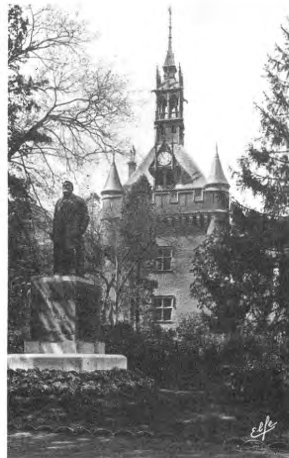
Sur le socle : "A Jean-JAURES, Apôtre de la paix. La Ville de Toulouse.