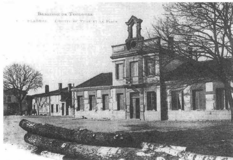
Ecole des garçons

Même si les conditions n'étaient pas idéales quant au local et aux maîtres, les petits blagnacais pouvaient fréquenter la classe d'un régent depuis le XVII e siècle et après la Révolution, l'école communale. Cela si leurs parents le désiraient : apprendre n'était pas une obligation. Bien souvent les jeunes enfants