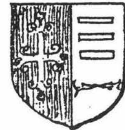
Ecusson de la Communauté de Blagnac