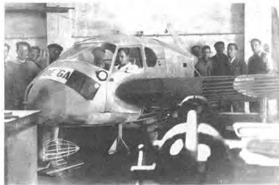
Les "Compagnons" et la "Bugatti de l'Air" dans leur atelier, après la Libération.