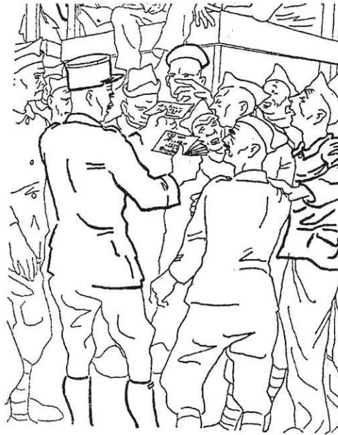
La distribution du courrier.

Le contenu des lettres lui aussi était surveillé au départ de l'Allemagne mais aussi de la France. Cela ne s'appelait pas "censure" mais la Direction du Service des prisonniers de guerre avait donné dès le 18 septembre 1940 des indications très précises sur les sujets à éviter dans les lettres. Le 2 mars 1941, une autre circulaire devait rappeler de façon impérative l'interdiction de "se faire l'écho de nouvelles d'ordre intérieur ou extérieur souvent inexactes et parfois nuisibles au moral des prisonniers":