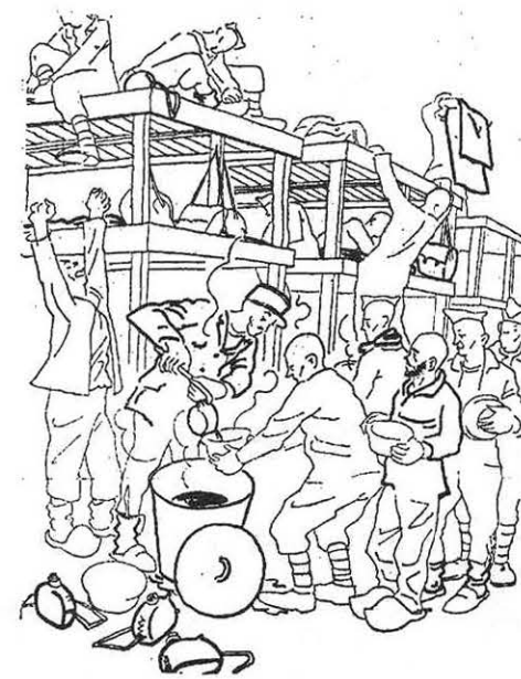
Au réveil, le café

Le climat, la faim sont souvent de rudes épreuves. Et toujours, lancinante, l'attente; l'attente du courrier, l'attente des colis, l'attente de la fin de cette situation absurde. Malgré l'accoutumance, malgré le travail, malgré aussi les distractions qu'ils organisent, ils gardent une idée fixe : le retour; question essentielle, quand ?