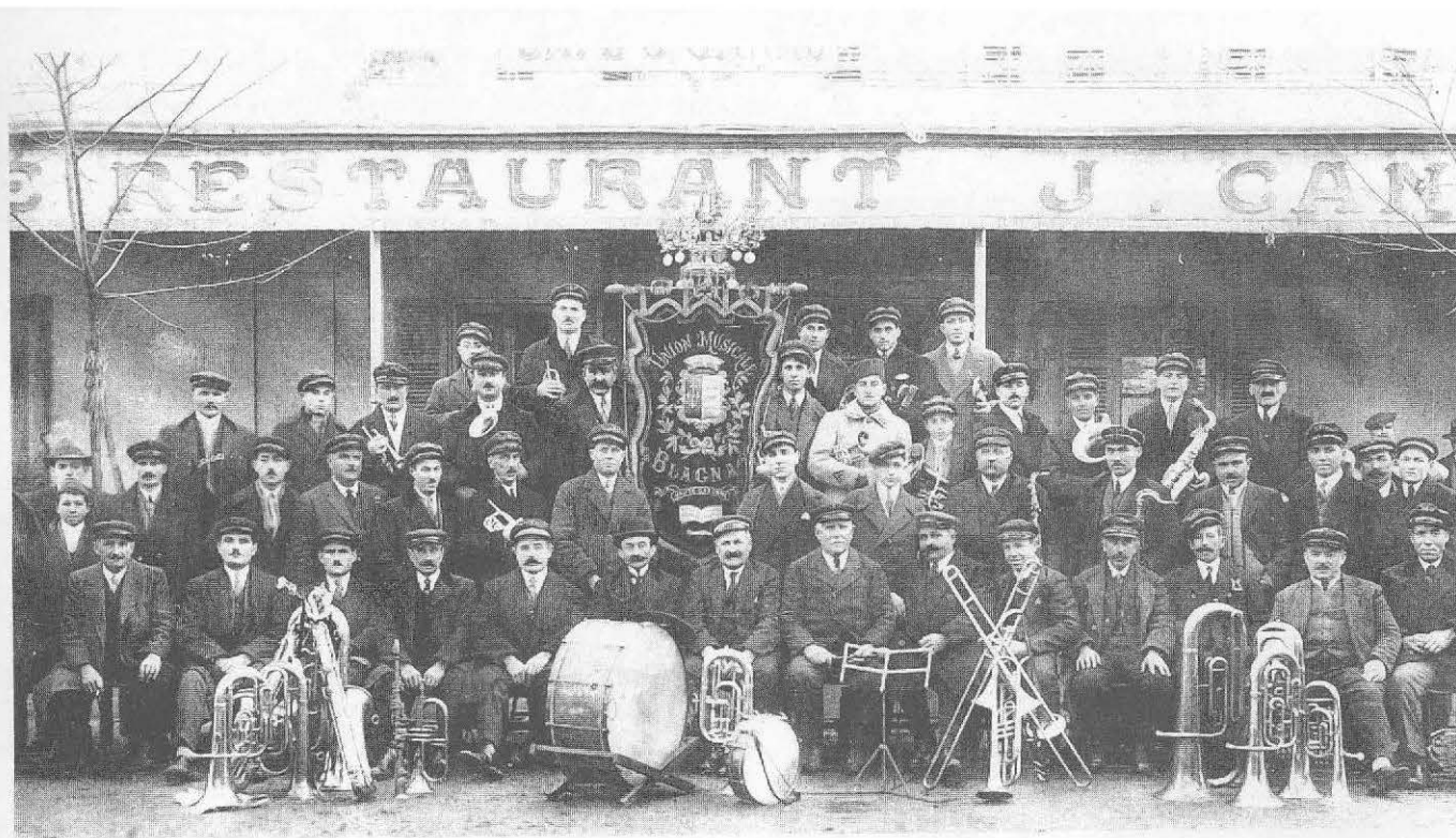
L'Union Musicale en 1927 (coll. J. Moncamp)

de haut en bas et de gauche à droite : (d'après les souvenirs de M. Moncamp)