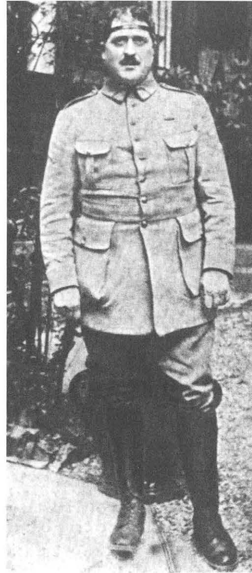
Guillaume Apollinaire en 1917, après sa blessure.

Ce n'est que vers deux heures du matin que le Bataillon atteint le fameux "Chemin creux". Je dois le suivre pendant quelques centaines de mètres, et prendre ensuite à gauche, avec deux compagnies, le boyau qui nous conduira à notre secteur.