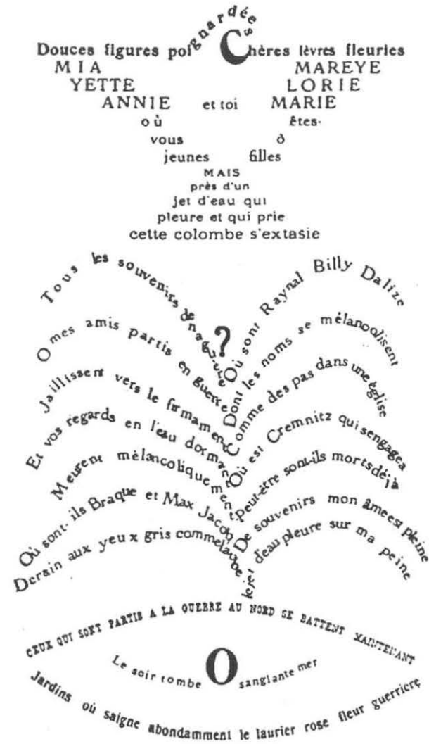
LA COLOMBE POIGNARDÉE ET LE JET D'EAU