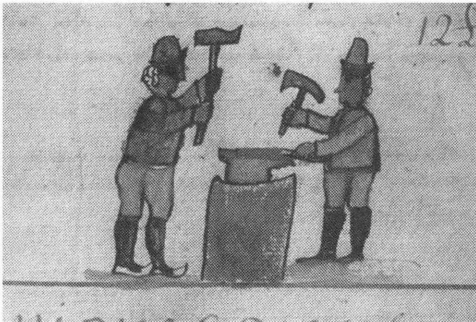
Un forgeron et son ouvrier au XVIII e siècle.