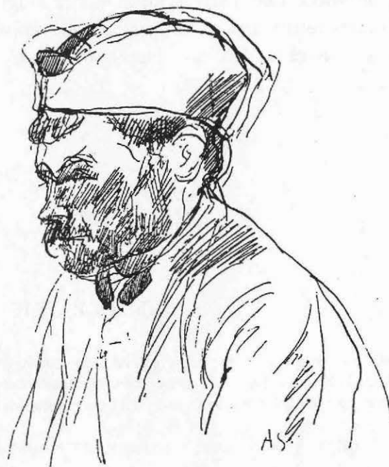
Croquis de Dunoyer de Segonzac, paru dans le Crapouillot, journal des tranchées.

Les guerres de la Révolution puisèrent là de nombreux volontaires. Celles de l'Empire augmentèrent le prélèvement. On connaît le mot de Napoléon : "l'Ariège est le pays des hommes et du fer" - Tournant à la boucherie, elles connurent moins de succès et nombreux vers la fin furent les déserteurs. Au début du 20 e siècle, les ressources diminuant - forêts épuisées, mines abandonnées - les jeunes s'orientèrent vers la