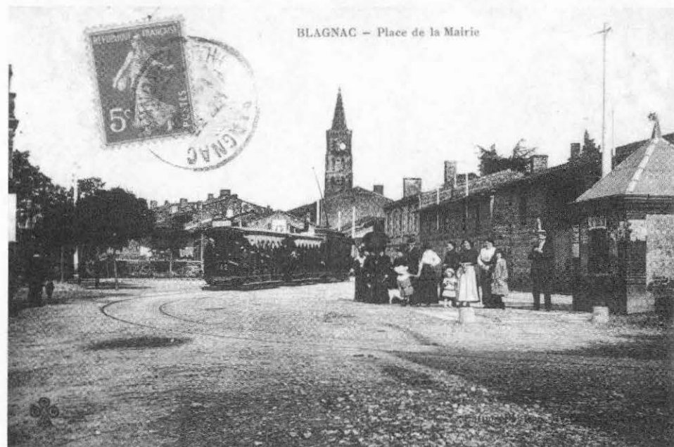
Le pont-basculé côté rue P. Ferradou

La pesée se fait sans incident et avec précision : le mécanisme extérieur, caché