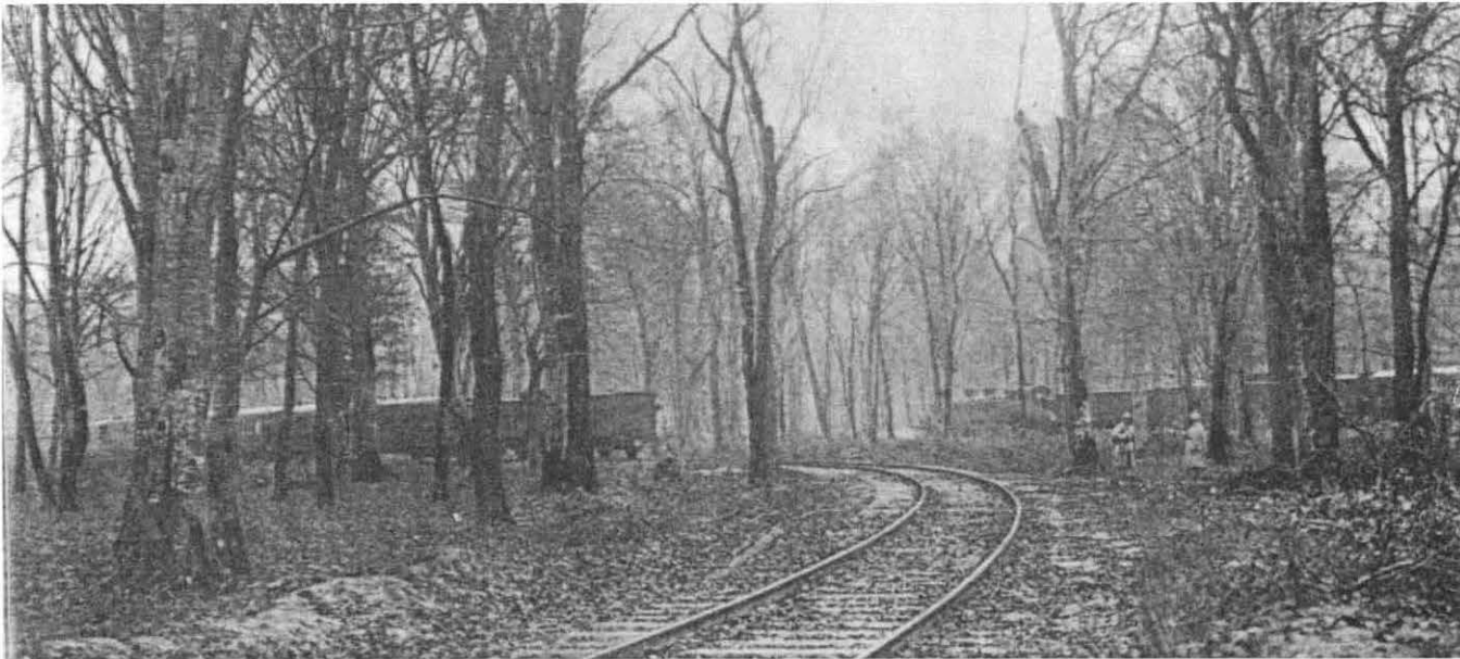
Train du Maréchal Foch où fut signé l'armistice

En forêt de Compiègne : le décor de la capitulation allemande.