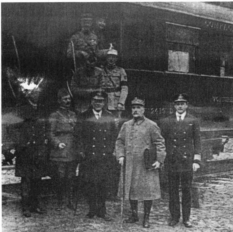
Gén. Weygrand. Amiral Wemyss Maréchal Foch Le manuscrit original de la convention d'armistice, revêtu des signatures du maréchal Foch et de l'amiral Wemyss d'une part, de celles des plénipotentiaires allemands de l'autre, est dans la serviette du maréchal

doute à cause du vent d'autan. Du côté de la route de Grenade où aucune maison ne cachait l'horizon, le soleil très bas à cette heure (nous étions en automne et nous «marchions» à l'heure solaire) formait une énorme boule rouge qui embrasait le ciel sans nuage. Je revois encore cette luminosité intense, ce couchant très rouge.