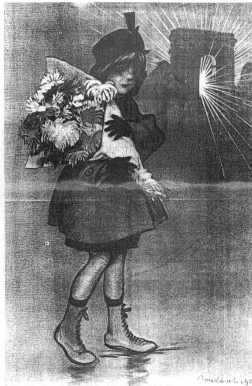
L'hommage de l'orpheline (Fonds R. Causat)

Je suis allée jusqu'au bout du chemin vers la rue des Ormes. Beaucoup de monde était dehors, il y avait beaucoup d'agitation. C'était une liesse générale. Je ne me souviens que de visages rayonnants de joie. Toutes les personnes tenaient des petits drapeaux tricolores en papier. Je suppose qu'ils les avaient achetés chez Françonnette, la mercière. Elle devait les avoir en réserve car on sentait la victoire