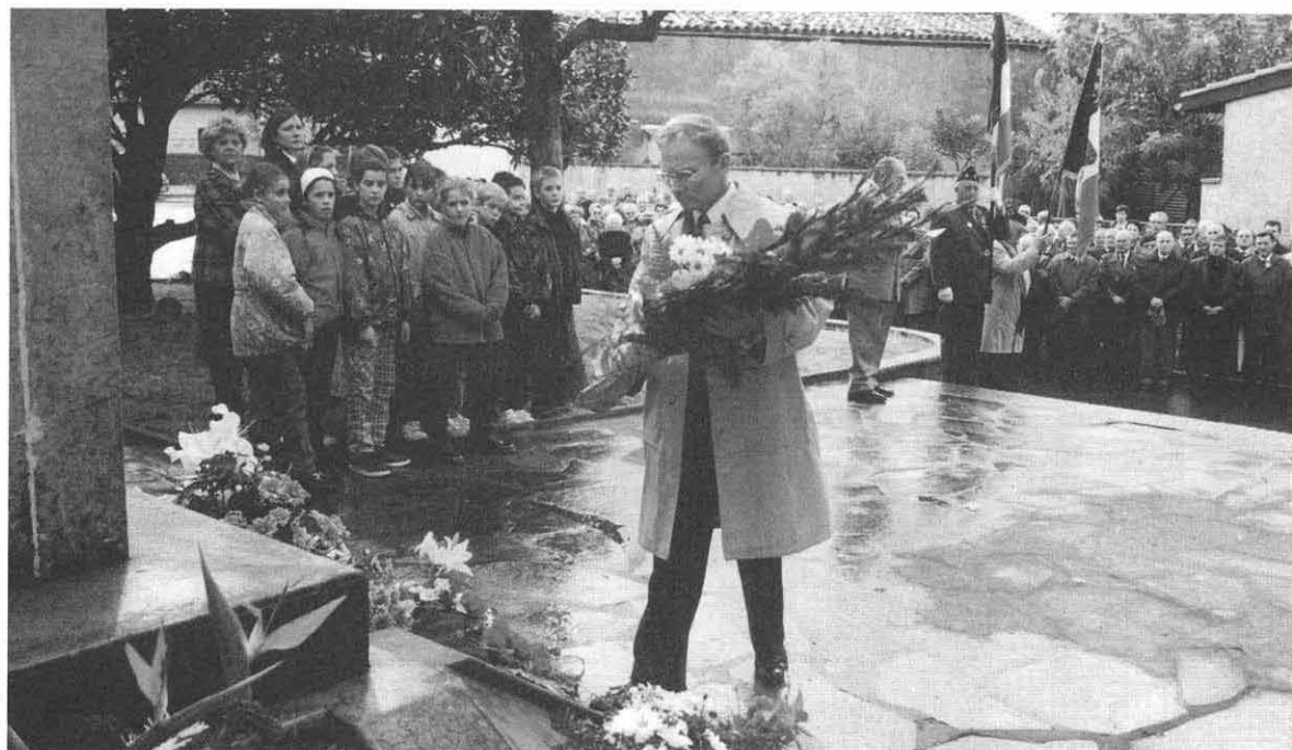
Le 11 Novembre 1997 : comme chaque année, dépôt de gerbes au pied du monument aux Morts de Blagnac pour commémorer la signature de l'Armistice du 11 Nov. 1918.