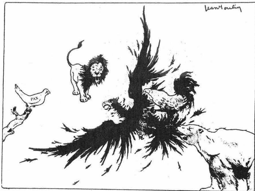
Dessin à l'encre de chine signé Jean Moulin (taille réelle 0,267 x 0,363). Allusion aux tentatives de paix de 1917.

arriver. La nuit est tombée, je suis rentrée. Mes souvenirs s'arrêtent là : le décor, la gaieté de la foule, les petits drapeaux. Je ne me souviens pas du lendemain. Je me rappelle seulement qu'il y a eu, quelques mois après, une émouvante et solennelle cérémonie à l'école. La maîtresse citait tous les noms des Blagnacais tués et, debout, nous répondions, à chaque fois : «Mort pour la France». J'avais eu une jeune cousin de 19 ans tué dans cette guerre. Mais je l'ai su après car on ne parlait pas de malheurs à de jeunes enfants.»