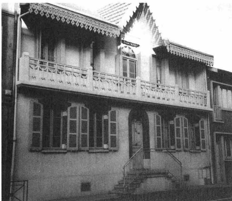
Sa maison rue Prosper Ferradou