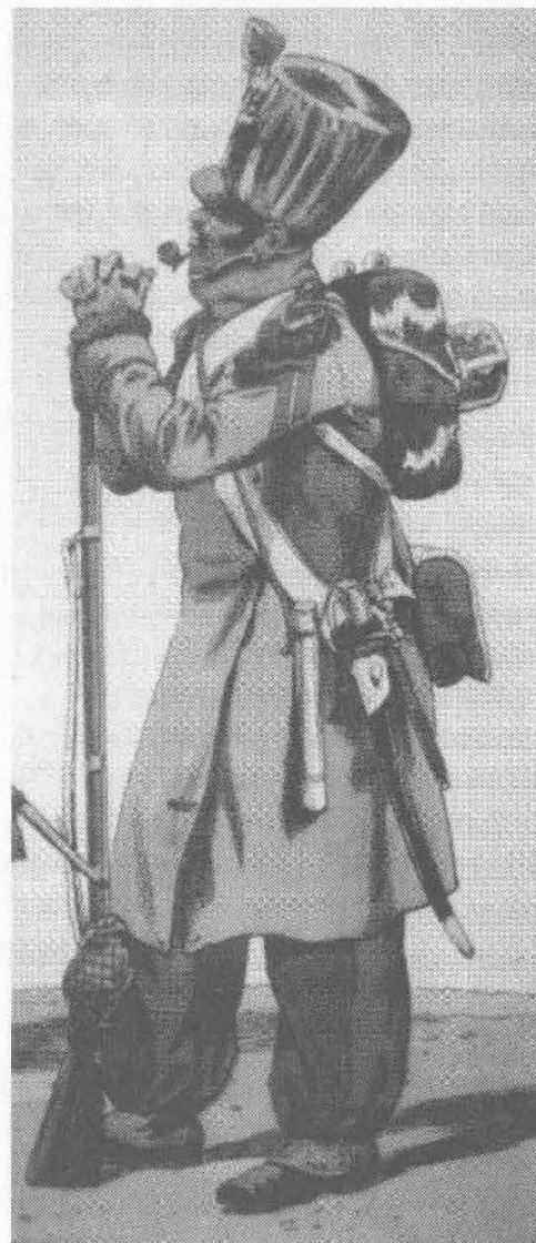
Fantassin français par Job.