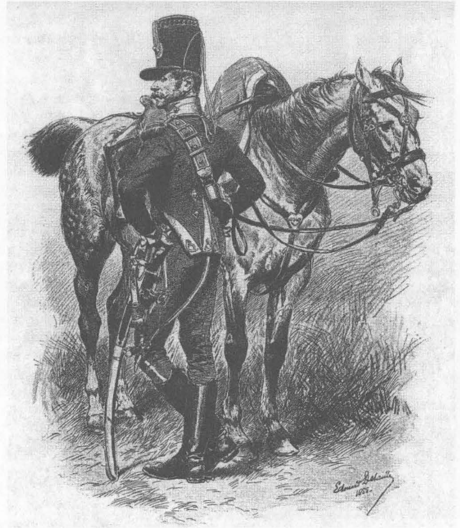
Chasseur à cheval - Officier (1 er Empire, 1813), dessin d'Edouard Detaille

L'armée impériale est en grande partie licenciée et notre héros fait partie du nombre des exclus.