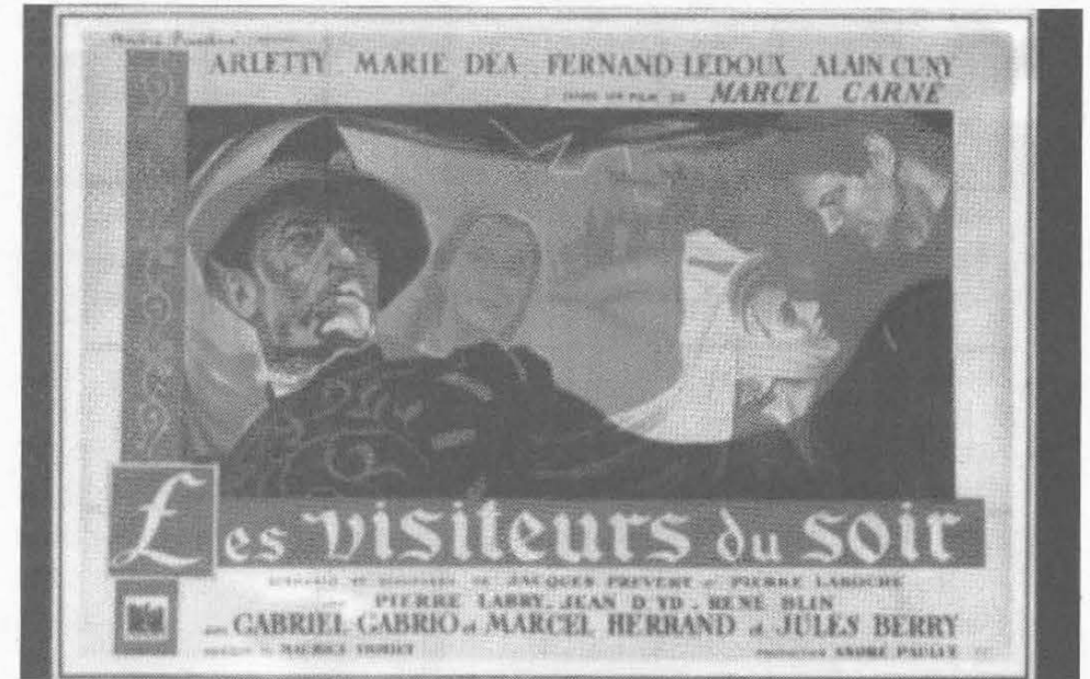
Les visiteurs du soir, l'amour plus fort que le diable incarné par Jules Berry.

Les directives de Mars 40 sont perfectionnées. Ces nouvelles actualités seront projetées dans toutes les salles en même temps. D'abord accueillies avec une certaine passivité, elles susciteront peu à peu des réactions moins pacifiques devant leur impudence à travestir la réalité. L'obscurité donnera du courage. Les timides murmures et protestations seront de plus en plus bruyants et offensifs. La riposte sera une mesure pour le moins curieuse dans une salle nécessairement obscure : la pro-