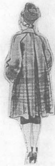
La mode s'inspire du cinéma redingote à la Poncarral (in Marie-Claire)

Ces différentes contraintes paraissent dérisoires en regard de la situation dramatique de Blagnac à cette époque : afflux de réfugiés fuyant la zone des combats, de soldats ayant échappé à l'encerclement, désorganisation des transports, du ravitaillement et surtout ignorance absolue et vive inquiétude quand au sort des combattants.