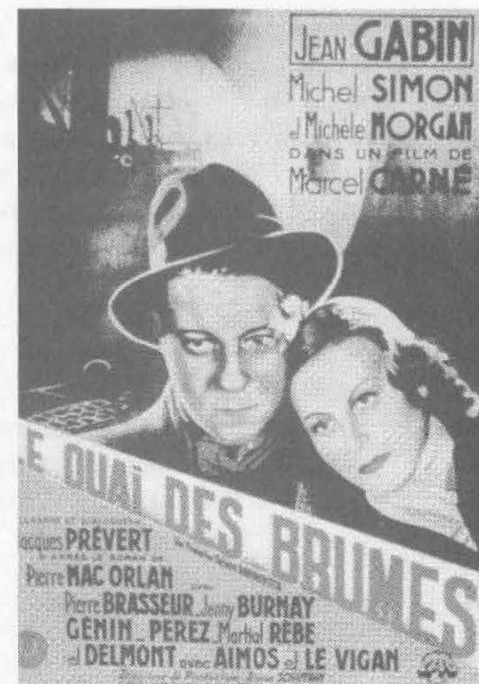
Quai des Brumes : un grand classique du cinéma français.

Comme Toulouse la grande métropole, Blagnac sera concernée par les mesures envisagées. Les salles de cinéma étant obscures par définition, la nécessité de camoufler toute lumière imposée par la défense passive ne pose guère de problèmes si ce n'est à l'ouverture et à la clôture du spectacle.