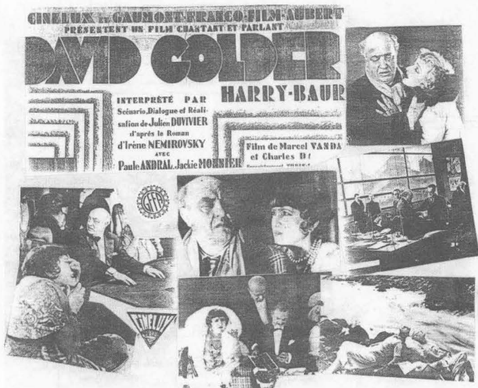
David Golder, quelques images d'un film «chantant et parlant» projeté à Blagnac dans les années 1930 parmi d'autres : La douceur d'aimer, Service secret, Romance à l'inconnue, Allo Mademoiselle, Mystère de la villa rose... dont les affiches sont conservées aux Archives Municipales de Blagnac.