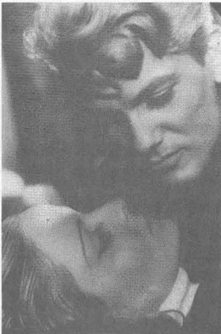
L'Eternel retour : Jean Marais, Madeleine Sologne, modernes Tristan et Iseut dans un film de Jean Cocteau.

Le Secrétariat général à l'information, Service du cinéma, se manifeste lui aussi. En mai 1941 par la voie préfectorale habituelle, Monsieur le Maire est informé et sollicité. En effet, les