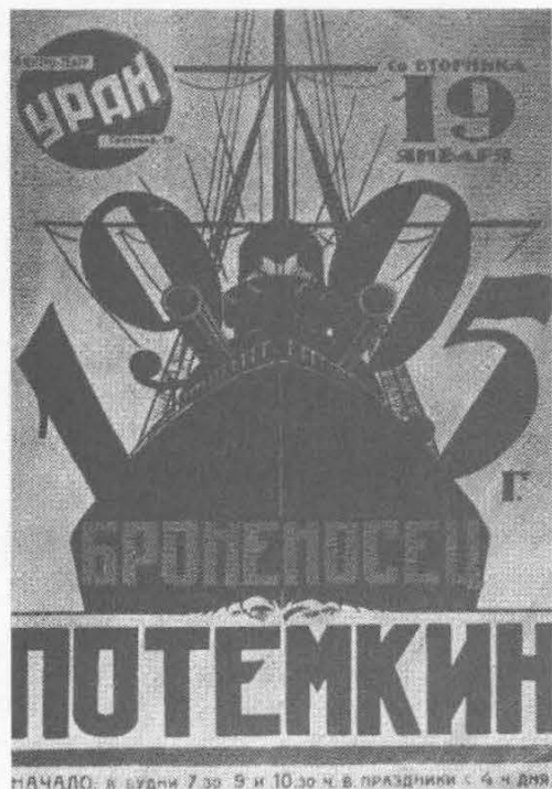
Le cuirassé Potemkine : un film interdit de projection par la censure.

déjà que toute copie de film projetée en public devait être accompagnée d'une fiche de visa signée par le président de la commission de contrôle exception faite pour les documentaires. Certains pouvaient donc être interdits de projection. Le « Cuirassé Potemkine », peut-être le plus célèbre d'entre eux, n'a pu être admiré à Toulouse que par des cinéphiles militants et astucieux, en projection privée.