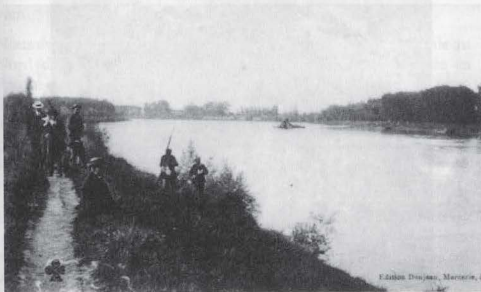
Ils pêchent en toute «légalité».

Alors que Kiki, évoqué plus haut, passeur d'eau à l'embouchure, bénéficiait d'un fermage, obtenu par adjudication, du Pont des Catalans au Moulin de Naudin, Marcel Buret, dédaignant tout semblant de légalité, avait pour seule profession celle de braconnier fluvial, en dehors de toute réservation. Son instrument de travail était « le tramail », filet à pan vertical de 1m à 1m50, encadré de deux rabats, également verticaux, sensiblement espacés du filet central, d'où le nom, « tramail » égale trois mailles. Lesté par des plombs qui le maintenaient au voisinage du fond, à une vingtaine de centimètres, soutenu en surface par des flotteurs, il se plaçait sur plusieurs mètres de long en barrage du courant, perpendiculairement ou