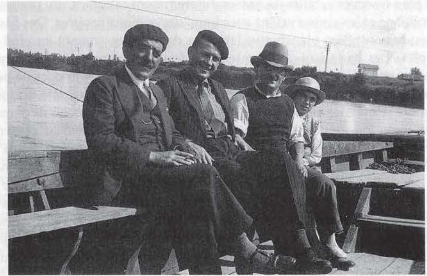
Avec le chapeau : «kiki», à sa gauche son fils et à sa droite son acolyte.

Enfin venaient aussi frayer en haute Garonne les saumons, poisson roi. On en voyait sous le Pont des Catalans, dans des « canelles », rigoles creusées naturellement dans marne, souvent accompagnés de grosses truites qui frayaient aussi, produisant les truites « saumonées ». Kiki en prenait alors