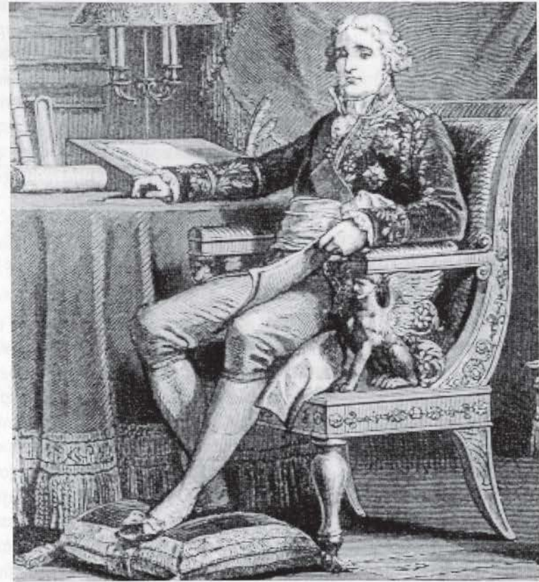
Portrait de Cambacères

Cela m'autorisa à entretenir avec mon voisin une conversation traitant de l'histoire du Premier Empire, période qui l'intéressait au premier chef. J'évoquai le Général Compans, qui eut château à Blagnac et y mourut (voir nos n°9 et 10). Je racontai comment, grièvement blessé à la Moscowa, ainsi que onze autres généraux, il avait été mis avec ses collègues dans une datcha transformée en poste provisoire de secours, où d'ailleurs n'officialait aucun infirmier. Chargé par Napoléon d'aller visiter les blessés, le chirurgien en chef de la Grande Armée, Dominique Larrey 1 , avait pu sauver de la mort Compans et Teste, trouvés seuls survivants des