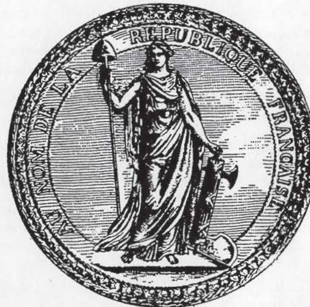
Sceau de la 1 ère République - 1792

Je remercie tous les services municipaux qui m'ont aidée à écrire certaines parties de cet article.