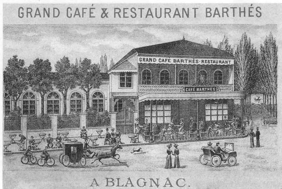
Etablissement Barthès vers 1900 avec vue sur la Garonne.

La photographie d'un document précieux de cette époque est aussi parvenue jusqu'à nous. C'était une affichette de la ville, gravure en couleurs sur fond rouge placée dans les omnibus de la ville pour inciter les Toulousains à venir goûter aux charmes, et ils paraissaient riches et variés, de l'Établissement Barthès. Devant les larges porte-fenêtres du bâtiment parfaitement identifiables, des dames en robe longue et « en chapeau » 1 fastueux, des messieurs en redingote, haut de forme et cannes à pommeau d'argent déambulaient paisiblement avec leurs enfants riche-