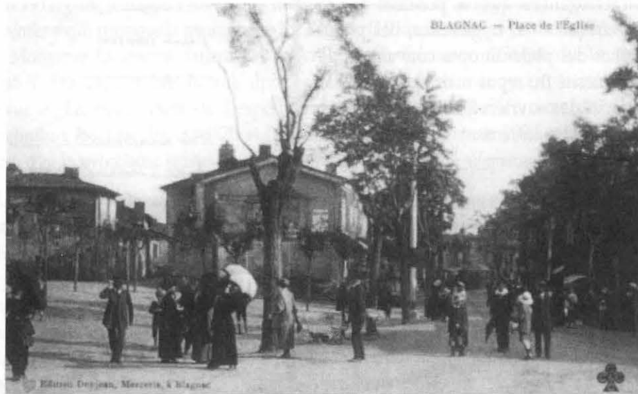
LesToulousains viennent de descendre du tramway qui s'éloigne et se préparent à passer une agréable journée.

Quand Madame Vve Fourtanier qui détient déjà un « café » désire ouvrir un bureau de tabac près du pont, sa demande examinée le 12 février 1924 est aussi très bien