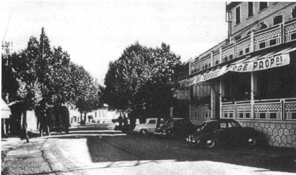
Quelques années plus tard, Monsieur Vergé a fait édifier une seconde terrasse.

Le dimanche était le jour faste en particulier la fête locale de septembre et surtout