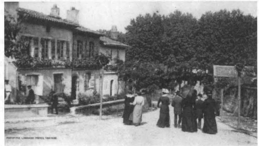
Allons nous promener au bord de la Garonne.

Les édiles locaux suivent de très près cette évolution de leur ancienne communauté rurale. Elle leur pose de nombreux problèmes. L'entretien du Canalet, des ramiers, des voies d'accès, la salubrité publique sont évoqués fréquemment, certains élus désirant, plus fortement que d'autres, soigner l'image de leur village pour attirer les citadins.