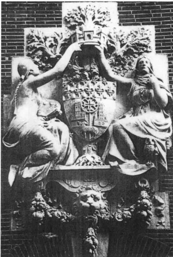
Toulouse : façade du Musée, rue Alsace. Blason de la ville.

Août 1922 : Abel Fabre quitte son appartement toulousain situé 33 rue des Lois et se rend en train dans les Pyrénées pour y séjourner chez des amis domiciliés à Bachos-Binos, petit village peuplé de 145 habitants proche de Luchon. En gare de Marignac, il décide malgré ses soixante-seize ans de ne rien changer à ses habitudes et de parcourir à pied, sac au dos et bâton à la main, les cinq kilo-