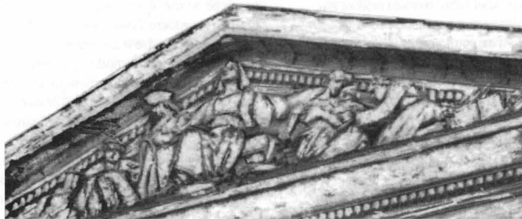
Faculté de médecine de Toulouse, Fronton situé côté Grand-Rond.