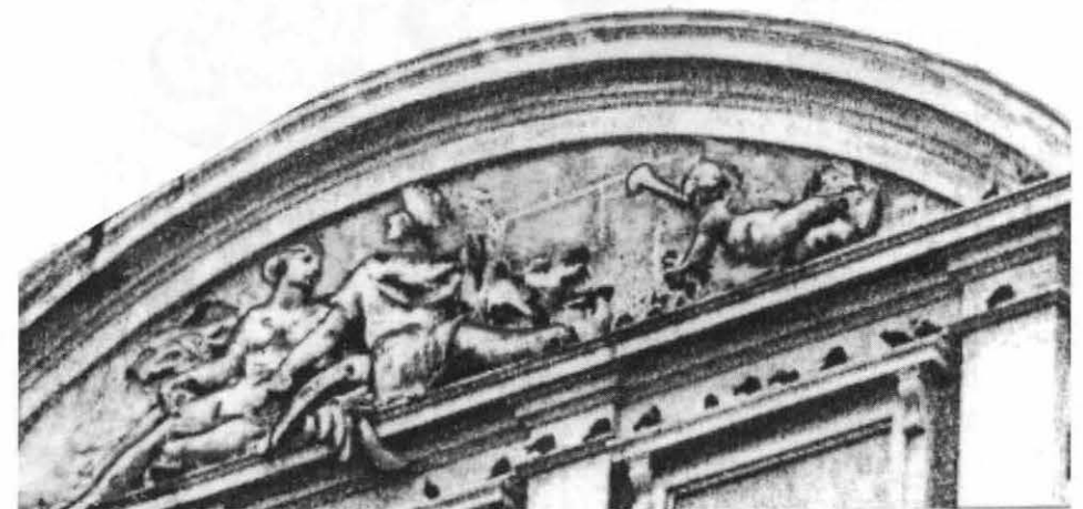
'Le Comte de Toulouse». Fronton du Capitole de Toulouse vu depuis la rue du Poids de l'Huile.