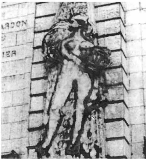
Allégorie de la sculpture. Façade de l'église des Beaux-Arts de Toulouse.