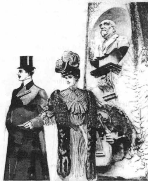
1904 : Mausolée du musicien Louis Deffès, auteur de la «Toulousaine».