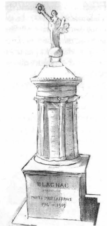
Maquette du monument aux morts de Blagnac.