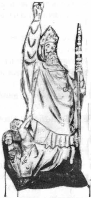
Statue de St-Jérôme. Eglise St-Jérôme de Toulouse