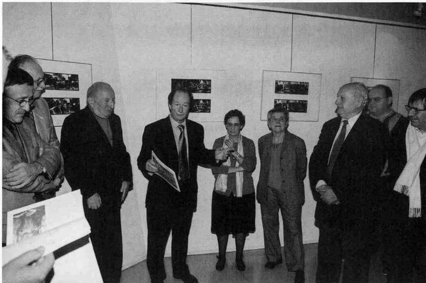
8 décembre 2000 : la revue «Blagnac, Questions d'Histoire» à l'honneur pour son 10 e anniversaire.