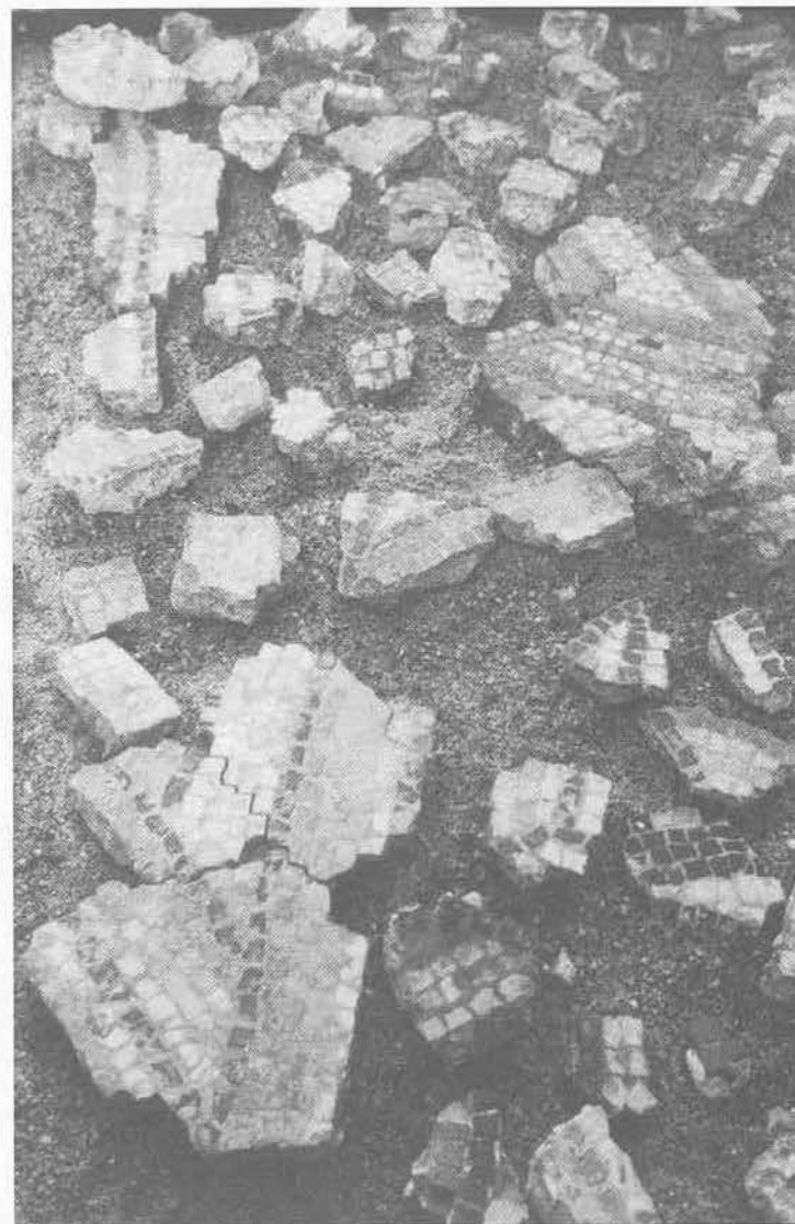
Morceaux de mosaïque trouvés dans la maison.

Enfin, un vieux four bâti en briques dont les restes dormaient dans les remblais garde encore son secret quant à son emplacement d'origine et son utilisation.