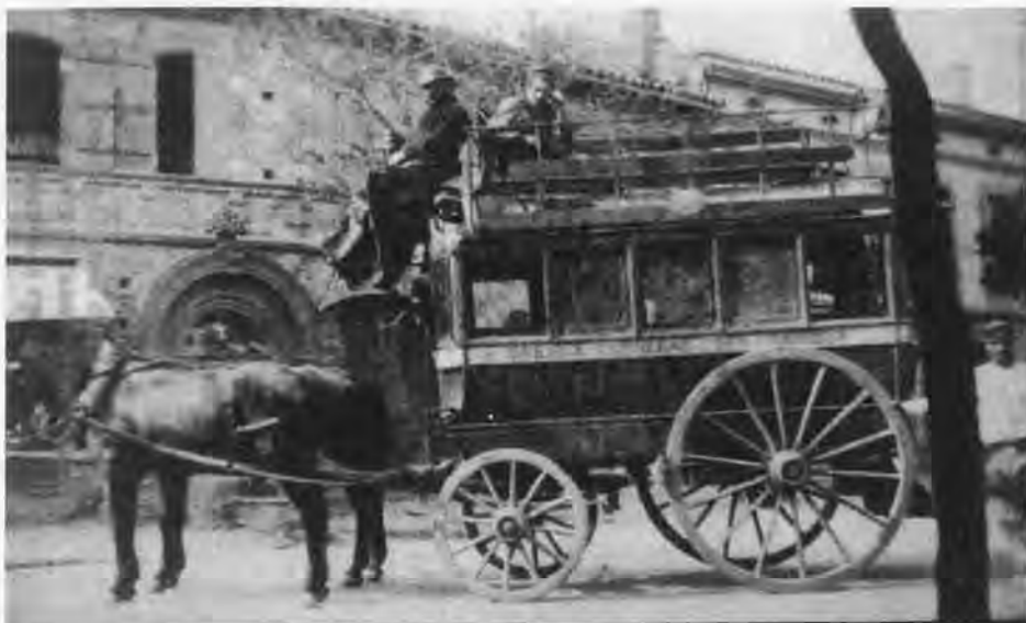
Puits à pompe (contre l'épicerie Baccalerie aujourd'hui bureau de tabac) place de l'Oratoire à moitié caché par les chevaux