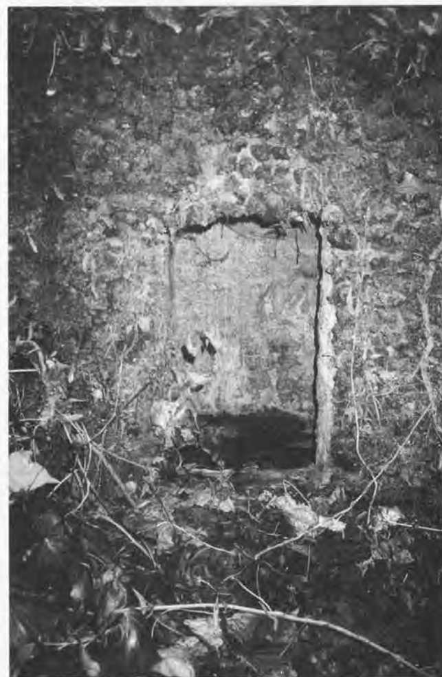
Ce qui reste de la fontaine de Saint-Exupère.

« Nos édiles » écrit l'abbé Massot «n'avaient pas soupçonné que les vieux souvenirs valent quelquefois plus que les espérances ». Par