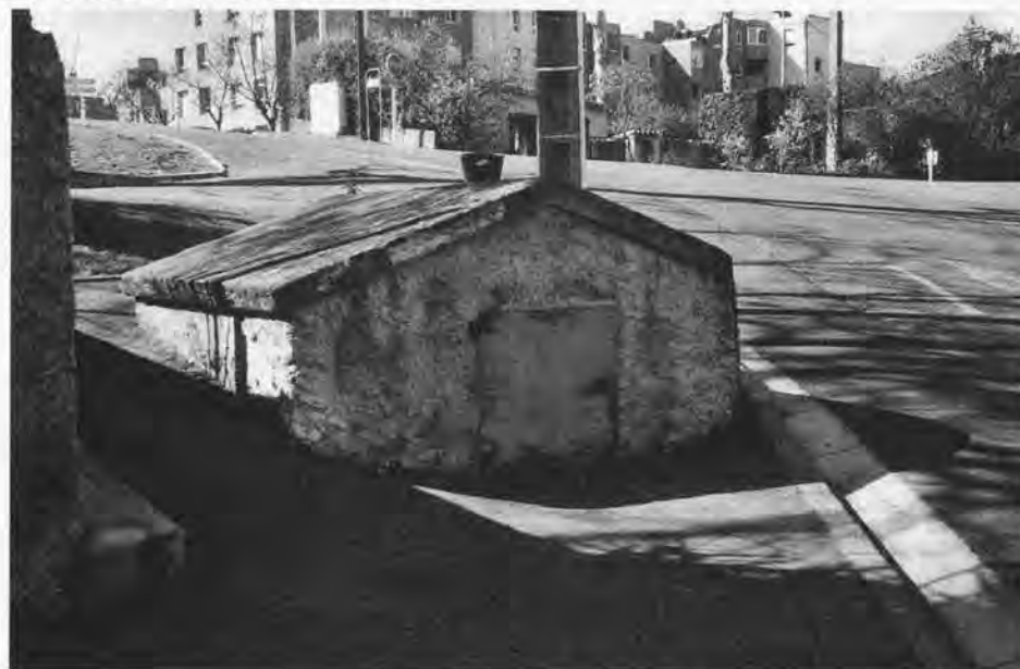
Au carrefour de Malard, la source des «Soeurs» fait entendre son murmure.