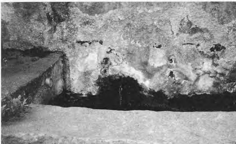
La fontaine des «trois cannelles» : elle coule toujours...