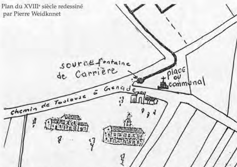
Plan du XVIII e siècle redessiné par Pierre Weidknet

Elle serait restée une simple notation sur le plan du XVIII e siècle si l'usurpation perpétrée par le Baron de Gary, propriétaire du château, n'avait causé, pendant des années, des démêlés et des protestations inscrits dans les délibérations municipales.