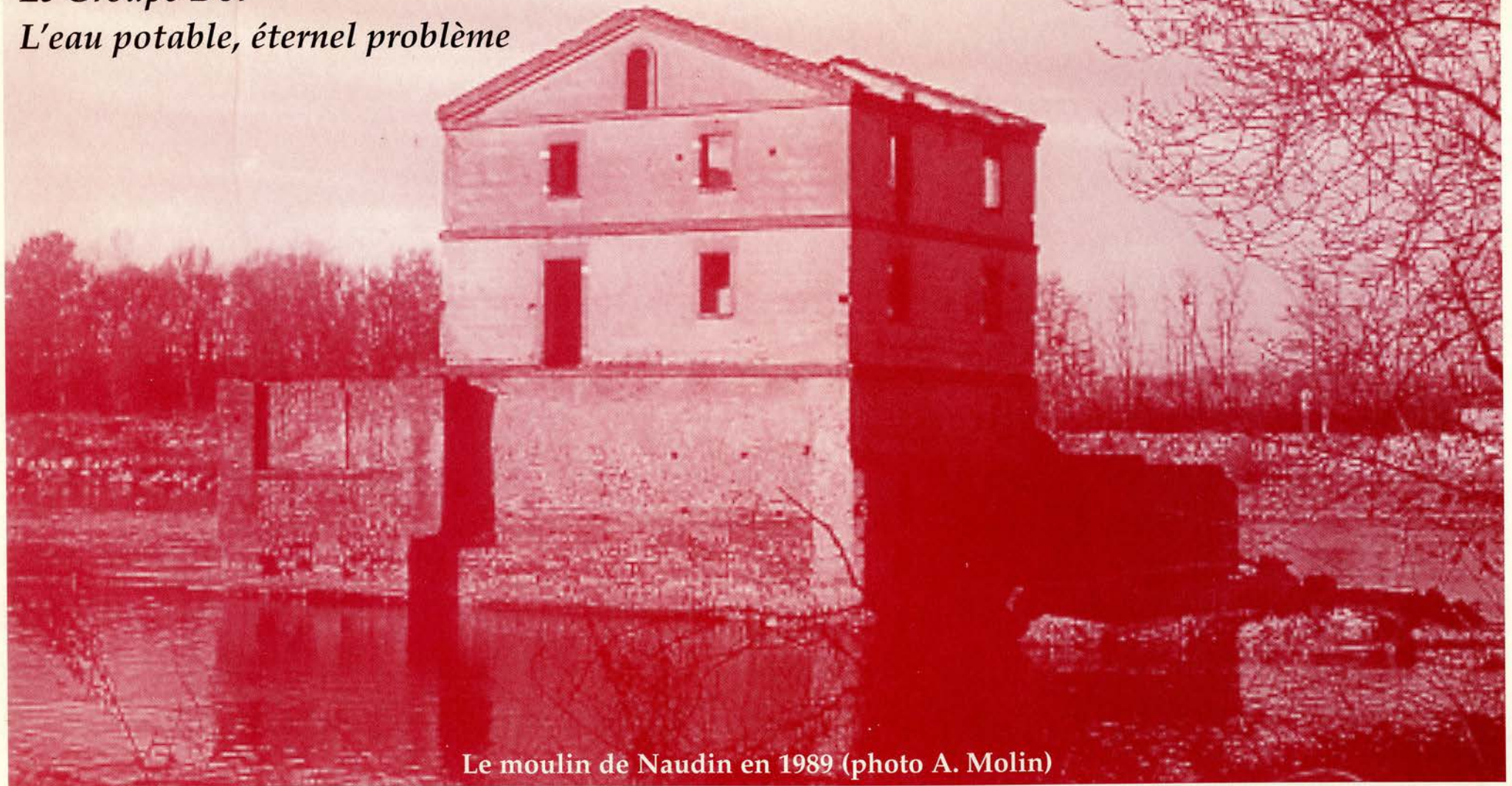
Le moulin de Naudin en 1989