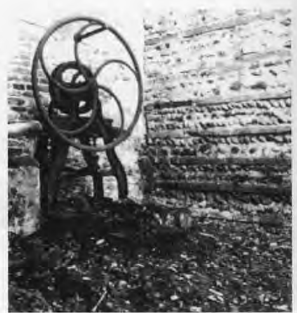
Pompe à chapelet

En 1845, l'équipe municipale décide de rechercher des sources nouvelles pour alimenter le village.