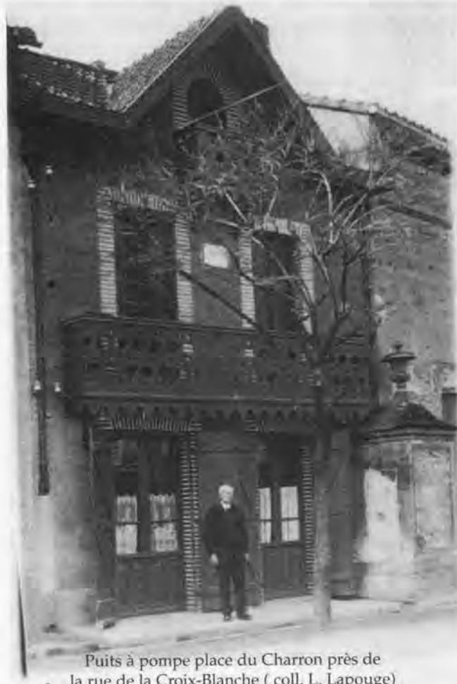
Puits à pompe place du Charron près de la rue de la Croix-Blanche

Deux puits semblent suffisants pour les besoins de la population du village. Les recherches s'effectuent sur la « place de l'Oratoire », une sorte de grand espace sur le boulevard face à l'église, et sur la « place du Charron », l'actuelle