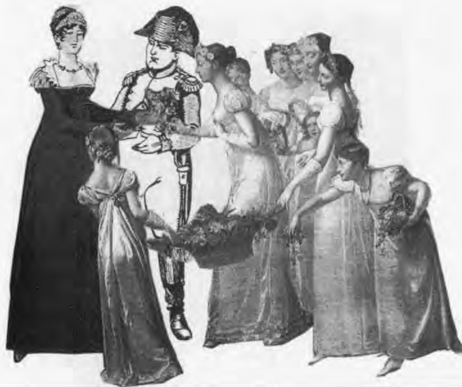
1809 : visite de Napoléon à la Maison d'Education d'Ecouen

Le souhait de l'Empereur est en fait la formation de femmes et de mères exem-