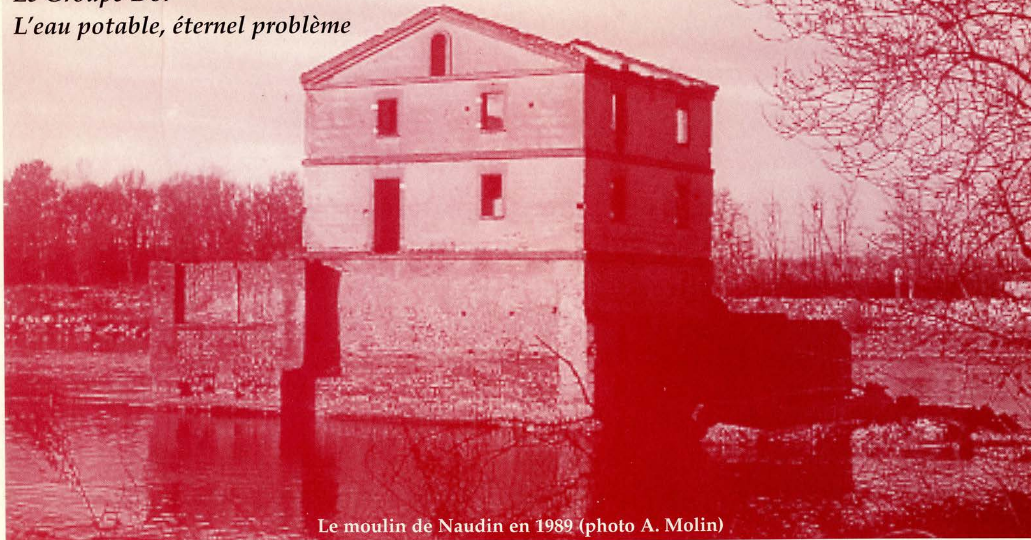
Le moulin de Naudin en 1989