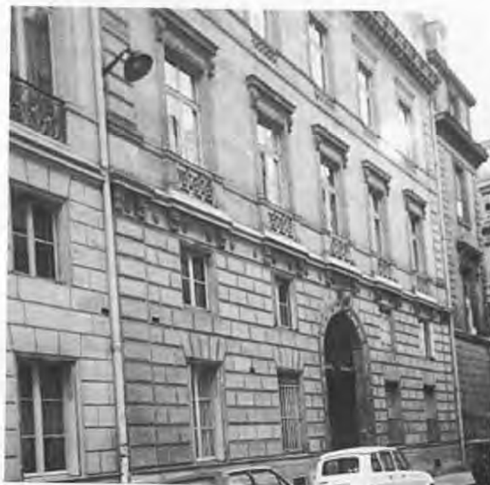
Résidence Compans, rue de l'Université à Paris.

grand officier de la Légion d'Honneur, demande un congé pour se rendre à Paris « afin d'y trouver l'occasion de donner suite à ses idées de mariage » (sic). La réponse du maréchal Davoust est positive : « J'ai touché dans la lettre à Sa Majesté votre désir de vous marier et vous pouvez compter