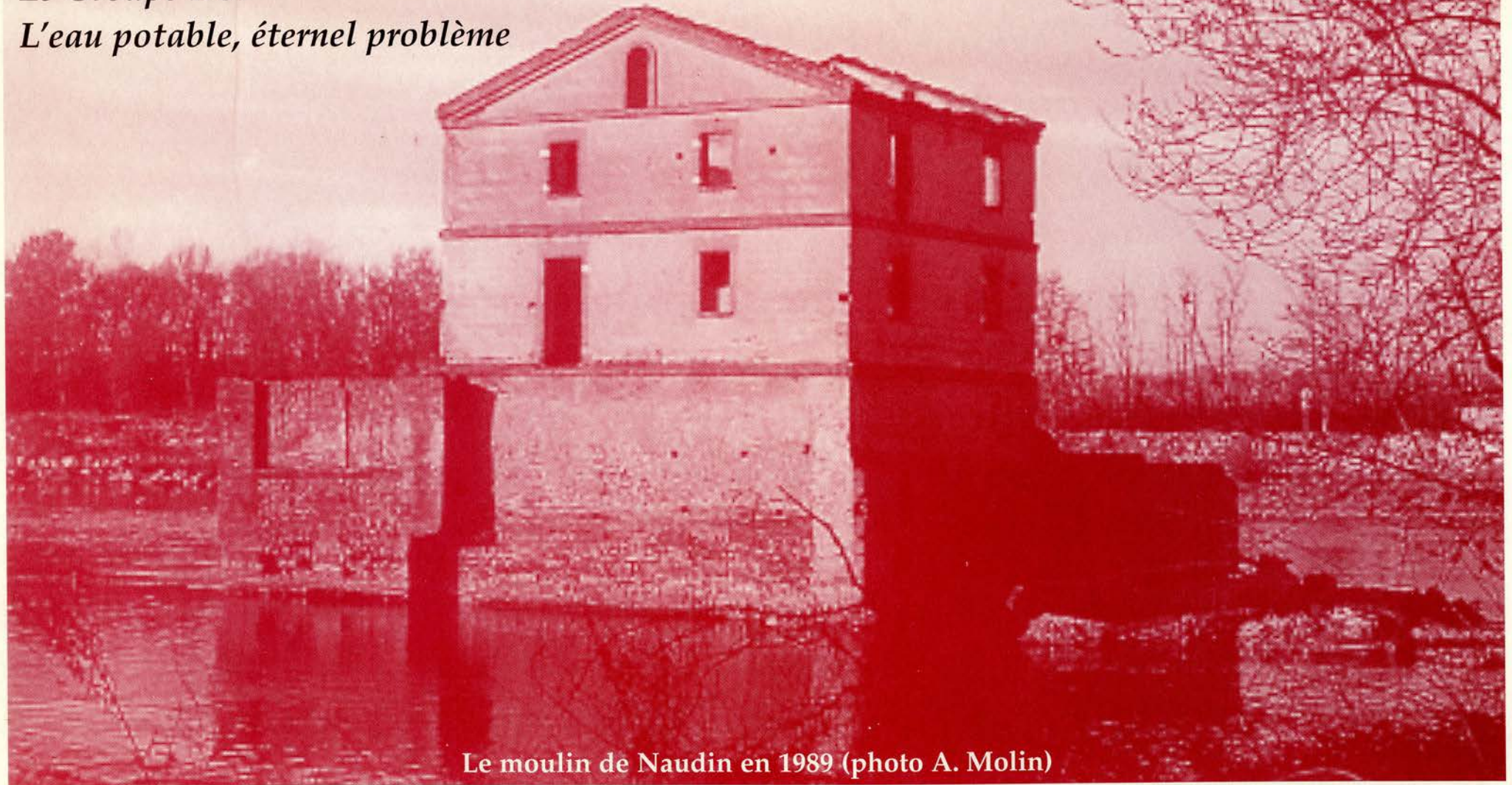
Le moulin de Naudin en 1989