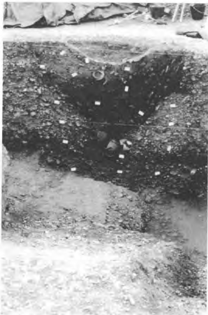
Poteries gauloises

Cette opération s'est déroulée d'avril à juin 2001 sur une surface d'environ 157 hectares. Elle a consisté à effectuer des sondages au moyen de pelles mécaniques. Les vestiges archéologiques sont apparus en moyenne à 50 cm de profondeur.