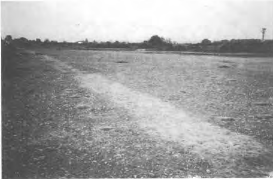
Vue partielle du site

Avant d'entamer des travaux sur un terrain susceptible de recéler un site archéologique il convient donc de saisir le service régional de l'archéologie.