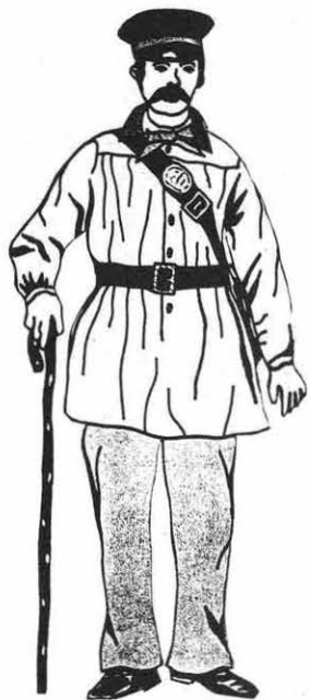
Facteur rural sous le Second Empire.

Le facteur d'alors part de Toulouse et dessert un vaste territoire : 40 kilomètres par jour ! Aussi la Direction des Postes « est obligée de donner un facteur tous les mois et ainsi le service est en souffrance ».