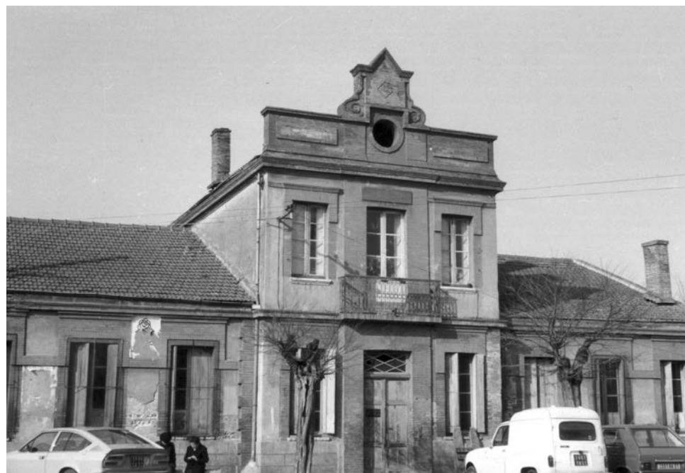
La mairie-école (Jean Jaurès) avant sa démolition

Cette école de deux classes passe rapidement à quatre. Des aménagements ont lieu dans les années 50 en ajoutant une classe sous le préau et un peu plus tard un étage avec trois classes.