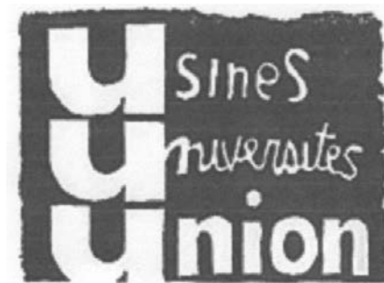
Affiche de l'époque (format réduit)

bureau ; les autres, debout, vont et viennent. Sonne huit heures. Le chef nous informe qu'il va y avoir une assemblée générale dans le « Hall Prototype », que nous sera posée la question d'occuper ou pas l'usine, que c'est la première issue qui l'emportera. Que nous devons tout ranger dans notre environnement de travail de façon à reprendre immédiatement lorsque le mouvement sera terminé.