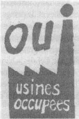
Affiche de l'époque (format réduit)

Une autre spécificité est la présence, à Blagnac, d'un gros Bureau d'Etudes. Au début des années 1950, la SNCASE (Société Nationale de Constructions Aéronautiques du Sud-Est) avait programmé la fermeture de ce Bureau d'Etudes. Il s'en était suivi un conflit important, et le maintien du BE. Heureuse conclusion qui a permis la construction du SE