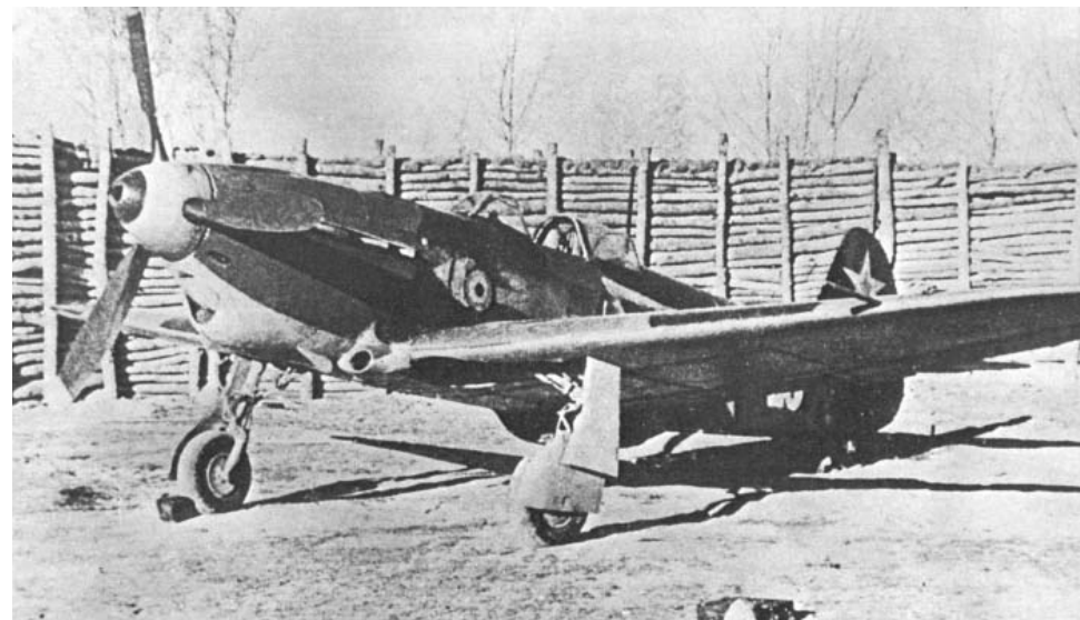
Le YAK 1, moujik des airs.

mandant Tulane lui succède, l'escadrille équipée de Yak 1 est rattachée à la 1 re armée aérienne soviétique et le 22 mars elle s'envole pour se rapprocher du front, au S.O. de Moscou.