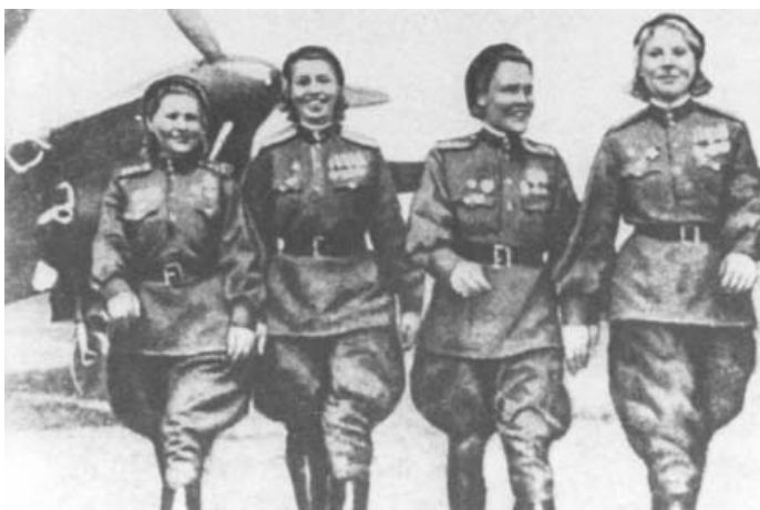
Au retour d'une mission, ces pilotes d'un régiment de bombardement exclusivement féminin viennent remercier leurs "amis français" pour l'efficacité de leur protection