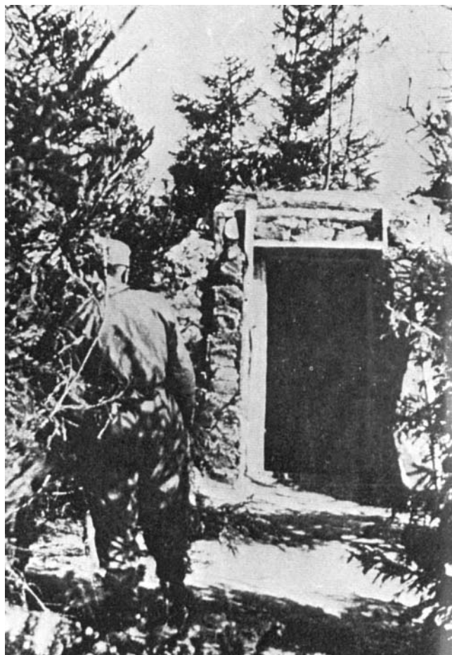
La ziemlenka, P.C. de Pouyade à Doubrovka.

En décembre l'Escadrille Normandie peut commencer son entraînement sur la base d'Ivanovo, au N.E. de Moscou après un passage rapide mais remarqué dans la capitale.