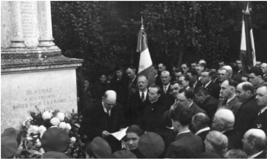
11 novembre 1936, cérémonie devant le monument aux morts dans le cimetière.