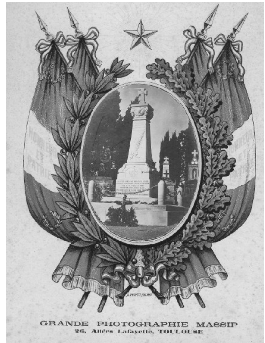
Photo-souvenir de l'inauguration.

Dans l'intervalle, la souscription a rapporté une somme de 2 000 francs. Le monument aux morts sera érigé dans le cimetière, au bout de l'allée centrale et les travaux débutent dès le mois de février suivant.