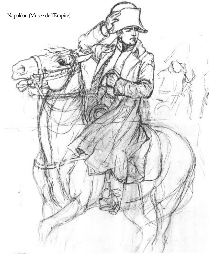
Napoléon (Musée de l'Empire)

ments d'Heisberg et de Friedland mais c'est à Eylau qu'il reçoit le baptême du feu, moins de trois mois après avoir étrenné ses épaulettes d'officier. Ce jour-là, les adversaires combattent avec acharnement sur un espace recouvert de neige. La charge irrésistible des 80 escadrons de cavalerie commandés par le maréchal Murat contribue à la défaite russe. Notre victoire est amère car le champ de bataille est recouvert de cadavres et de blessés des deux camps.