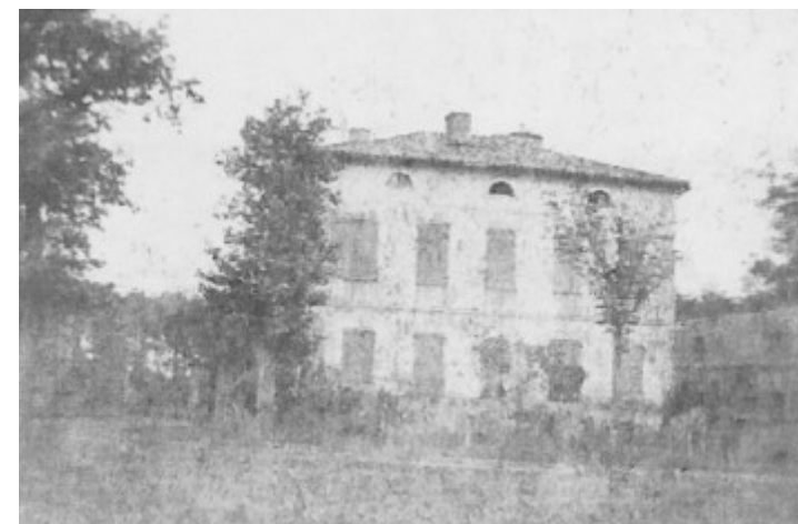
Domaine du Bousquet