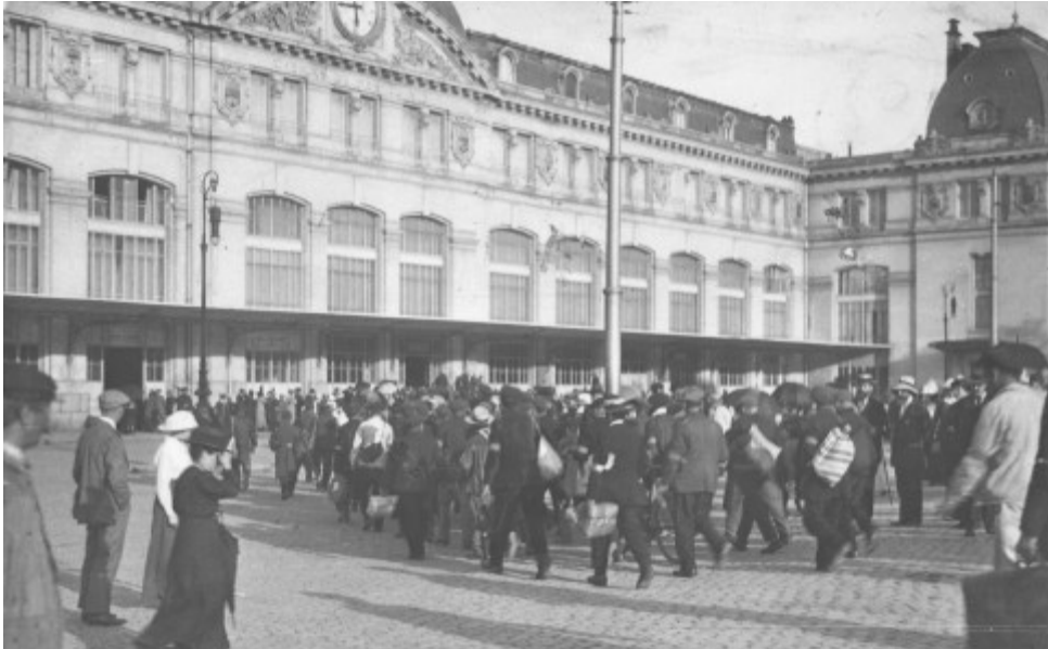
Août 1914 : les premiers départs