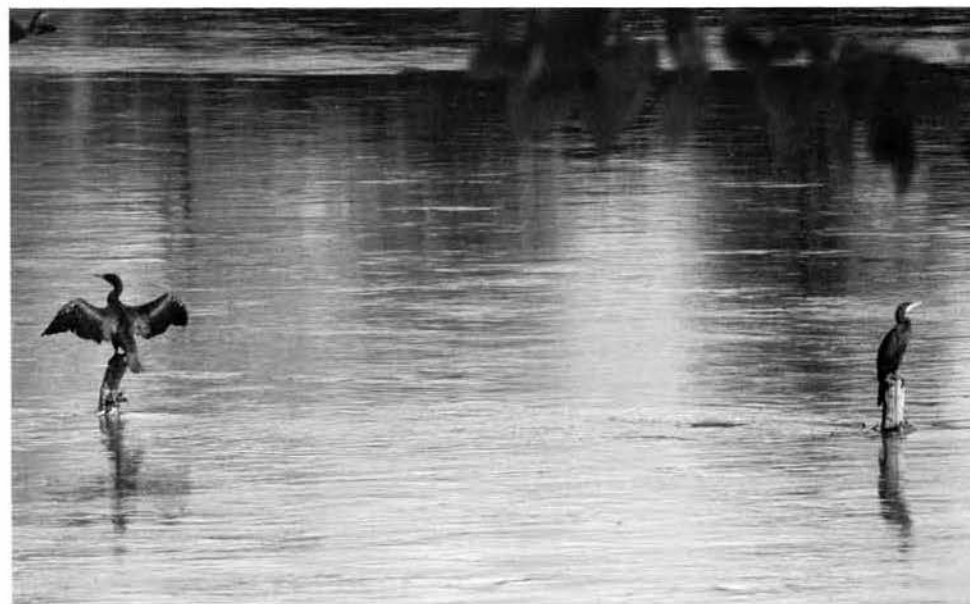
Les restes du garde terrain de M. Debax servent aujourd'hui de perchoir aux cormorans.

Les travaux de protection des Quinze Sols ayant fait la preuve de leur efficacité, il fallut les entretenir. Le 21 mars 1863, avec l'autorisation du Préfet de la Haute-Garonne, fut créé un syndicat réunissant les propriétaires intéressés par les travaux pour la conservation des Ramiers (Quinze Sols).