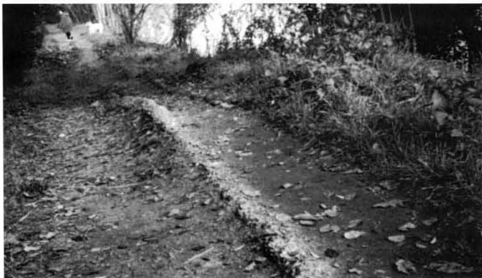
Vestiges de la digue de Soeur Hildegarde en aval du pont de Blagnac

Quinze Sols mais les protégea du courant furieux du fleuve cherchant à retrouver son ancien lit. Les travaux furent rapidement achevés et une crue au printemps 1847 attesta de la solidité de l'ouvrage.