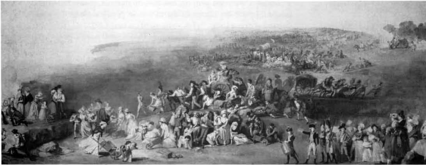
Travaux au Champ-de-Mars "La journée des brouettes" par Ch. E. Legay (Musée Carnavalet-Paris)

la Chronique de Paris écrit le 9 juillet : « Il faut voir cette fourmilière de citoyens, cette activité, cette gaieté dans les plus durs travaux ; il faut voir cette longue chaîne qu'ils forment pour tirer des charrettes surchargées (...). Tous chantent à la fois « ça ira » (...). Que l'on ne croit pas que l'envie de se montrer les dirige. Quelques-uns n'arrivent qu'à la nuit après avoir passé toute la journée à des travaux pénibles (...) Nous avons vu des hommes choisir les grosses mottes pour les transporter dans leurs mains. Nous avons vu une femme déjà avancée en âge et qui paraissait peu habituée à la fatigue, faire plus de vingt voyages avec de la terre dans son tablier... »