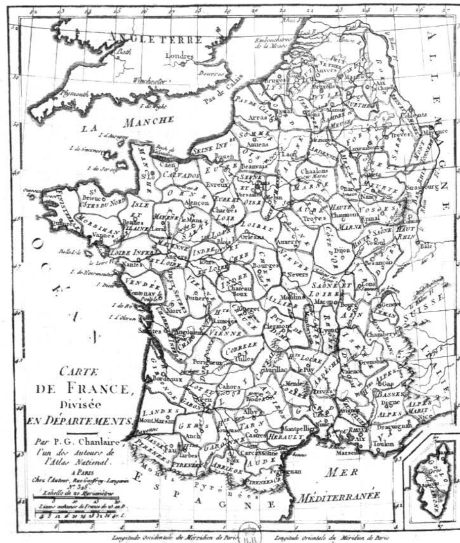
Les 83 départements par P.G. Chanlaire. (B.N. Paris)

l'inverse, la légion de Saint-Nicolas, représentant le quartier populaire de la rive gauche, dénonce ces agissements. La municipalité élue en février 1790, sincèrement acquise à la Révolution, mais socialement modérée, affronte de nombreux incidents dus à ces dissensions au détriment de l'organisation d'une Fédération.