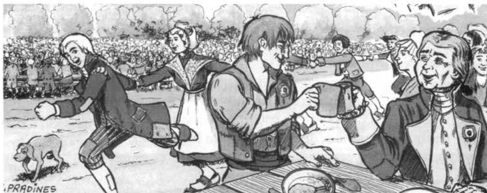
Dessin de R. Pradines

Tandis que les uns se rendent à des soupers « politiques », les autres, plus modestes, dansent et se réjouissent jusqu'au jour dans les rues illuminées.