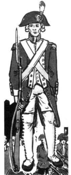
Un membre de la Garde nationale

Pour faire face plus efficacement aux dangers que présentent les adver-