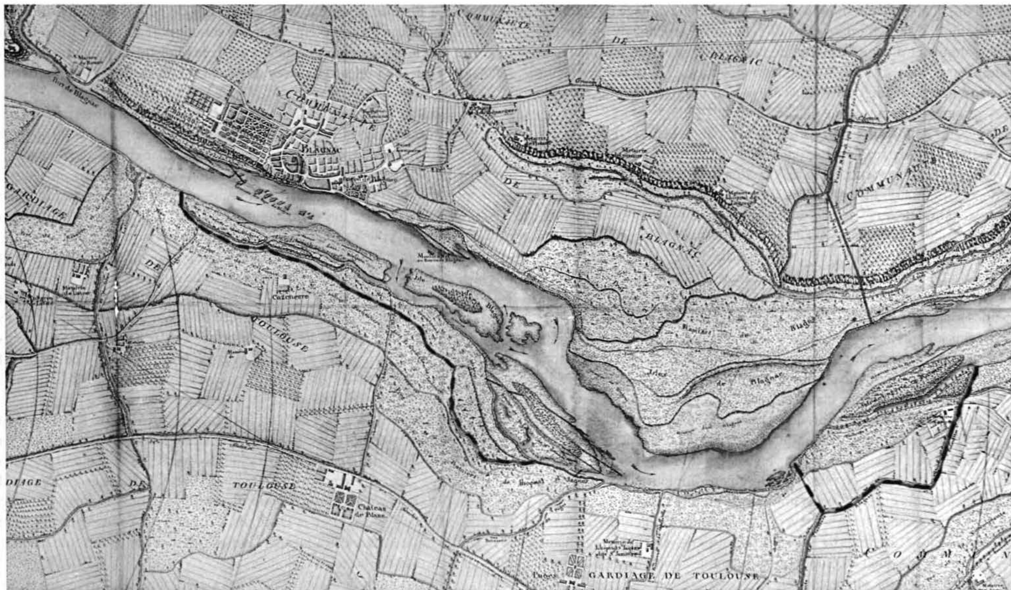
----- Limite des terres de la rive droite cédées à Toulouse par Blagnac.