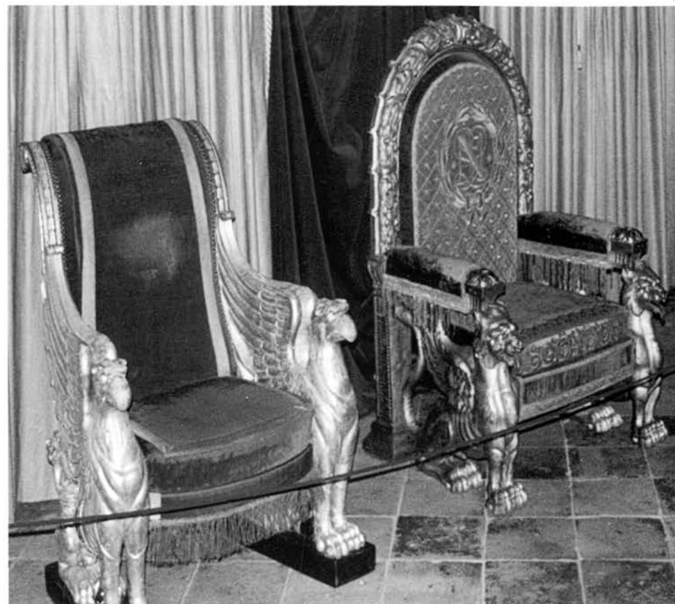
«Les deux trônes » Musée Paul Dupuy

En 1808, il réalise les trônes destinés à la réception de l'Empereur et de l'Impératrice au Capitole 2 .