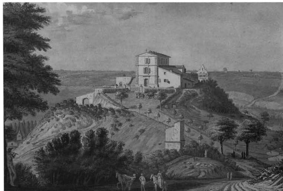
« Vue du château de Cornebarrieu sous le Premier Empire, dessin de F-S Meilhau (Musée du Vieux Toulouse) »

Mais, en novembre 1811, la maladie le contraint à revenir à Toulouse. Il est très faible et doit scinder son voyage de retour en deux étapes, s'arrêtant deux jours à Limoges puis accueilli par des amis à Lespinasse. Il passe