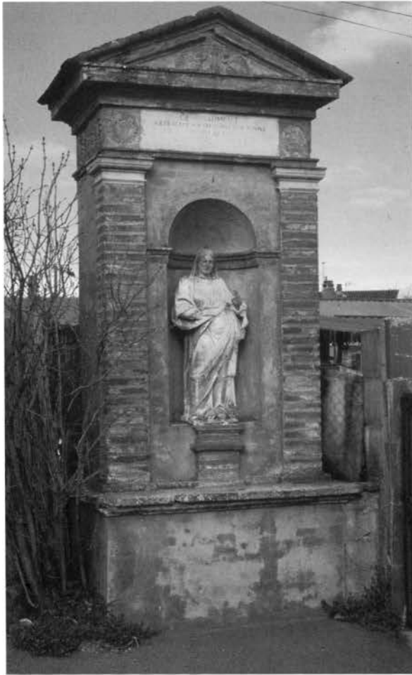
« Oratoire de la Vierge Rue Saint Jean à Cornebarrieu »