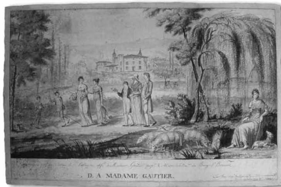
« Le Château de la Cassagne » en 1807 (Musée du Vieux Toulouse)»

Peu de dessins sont aujourd'hui connus : trois seulement, en plus du plan de l'ancien cloître de Saint-Sernin. Une « Esquisse perspective du château de La Cassagne appartenant à Monsieur Gautier, prop re et maire