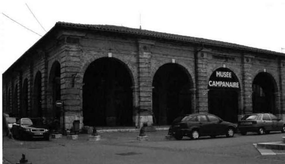
« La halle de l'Isle Jourdain »

À Cornebarrieu, ces travaux concernent la consolidation de la toiture de la nef principale (seule existante à cette époque) et d'une partie du clo-