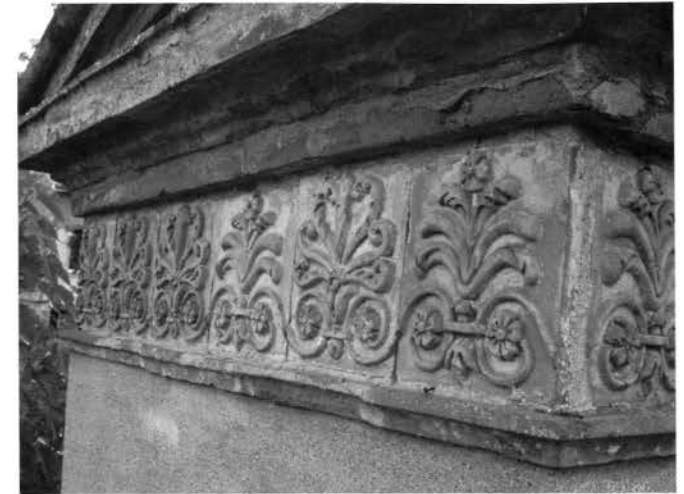
« La frise de terre cuite »

Le fronton présente des décors de terre cuite moulée ; décors qu'il placera aussi sur d'autres édifices. Deux angelots, de part et d'autre d'une urne, complètent l'ensemble. La statue de la Vierge est probablement beaucoup plus ancienne avec un corps en pierre, mais complétée par une tête en terre cuite et une main en bois (aujourd'hui disparue). On peut imaginer qu'il s'agit d'une réutilisation à partir de l'oratoire antérieur.