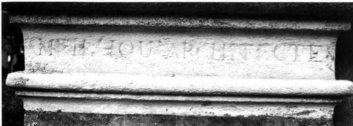
« La signature de l'architecte sur le pilastre »

Grave et à diverses églises (Longages, Lapeyrouse-Fossat, Fronton, Cornebarrieu).