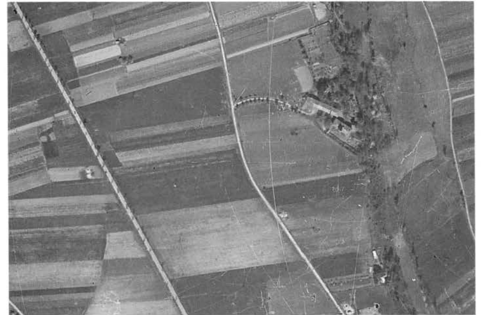
« Vue aérienne de 1946 »