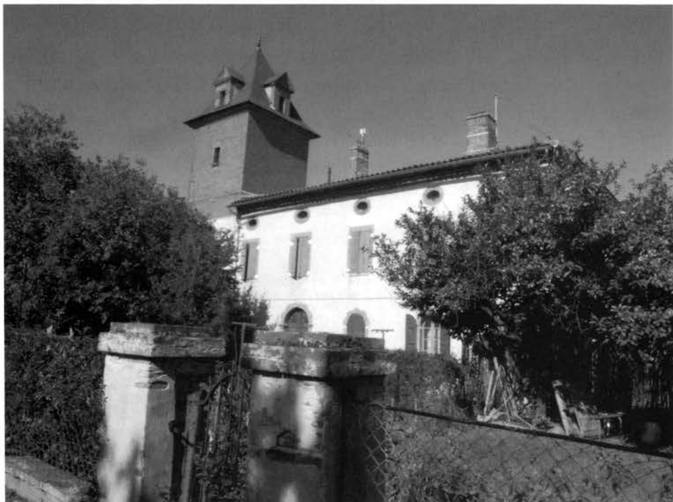
« Uzou, aujourd'hui »

Dès lors plusieurs propriétaires se succèdent, en particulier les Toulousains M. et Mme Crozes. Cette dernière, devenue veuve, est restée dans la mémoire de nombreux Blagnacais. Elle vient à Uzou très souvent dans les années trente et surtout durant la Seconde Guerre mondiale. Elle trouve là tout le ravitaillement nécessaire, les terres étant exploitées par son métayer. Elle fait installer le téléphone dans le bâtiment avec tour. Cet « équipement » est très rare à l'époque surtout pour un particulier !