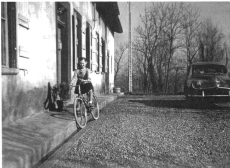
La métairie du Paour vers 1960

C'est ainsi qu'un sobriquet succède à un autre : « Paour » a détrôné « Berdoulet ». Et le lotissement dont la construction débute en 1976 sur les terrains appartenant alors à la famille Menon, l'a conservé.