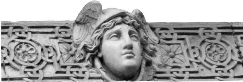
« Motifs en terre cuite au-dessus des fenêtres du premier étage »

propriétaire d'Uzou tout en habitant Toulouse et en y exerçant son notariat. Il vient souvent au domaine, y passe sa vieillesse et y décède le 15 novembre 1837 à l'âge de 93 ans. Selon toute vraisemblance (mais nous n'avons trouvé aucun document pour le confirmer), il aménage la métairie afin de lui donner une apparence plus en rapport avec sa condition sociale. Il érige la tour servant d'habitation et de pigeonnier, décore la façade d'un balcon d'apparat et de motifs en terre cuite... Désormais, les Blagnacais nomment cette belle demeure « château ».