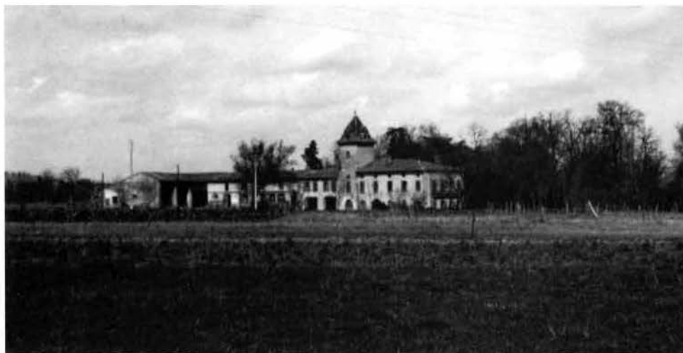
« Uzou, dans les années cinquante »