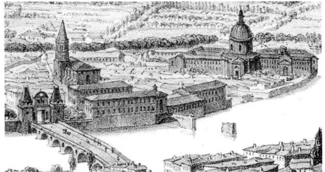
« L'Hôtel-Dieu Saint-Jacques et La Grave vers 1850 – Lithographie de Villemain »

En ce qui concerne les individus de la seconde classe, les membres du bureau de bienfaisance doivent vérifier « qu'ils sont réellement malades ou infirmes ». S'ils sont soignés à domicile, le bureau paie les médicaments. Si leur maladie est vraiment trop grave, le bureau délivre un certificat pour leur admission à l'hôpital ou à l'hospice de Toulouse et participe aux frais. Les vieillards soignés chez eux ou envoyés à l'hospice appartiennent à la troisième classe.