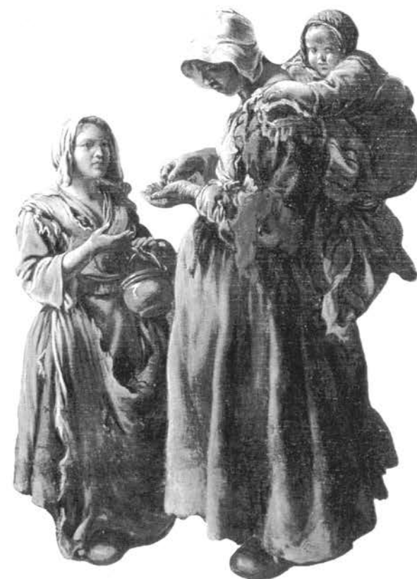
« De pauvres paysannes par – Sébastien Bourdon »

En décembre 1870, le président de la commission municipale en sollicite un pour Thérèse M... qui vient d'accoucher d'un garçon et qui désire le garder avec elle. Cette jeune fille « profession de passementière, native de Blagnac et y demeurant, se trouve dans l'indigence la plus absolue (...), sa mère veuve n'a d'autres ressources qu'un faible salaire de fille de service et par conséquent se trouve dans l'indigence... ». Même en travaillant, cette mère ne peut pas aider sa fille, son médiocre salaire ne lui permet même pas de vivre décemment.