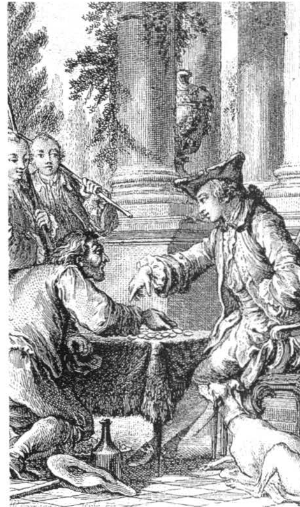
Le paysan payant la dîme ( gravure de 1761 d'après Eisen. Bibliothèque des Arts Décoratifs à Paris)

Les Blagnacais ne négligent pas pour autant les pauvres. Le 21 juin 1615, réunie en assemblée générale, la communauté « délibère de prendre les mesures nécessaires pour contraindre le Chapitre de Saint-Sernin (...) à donner aux pauvres de la localité, le sixième des dîmes qu'il prélève sur le lieu de Blagnac, ainsi que cela se pratiquait autrefois ».