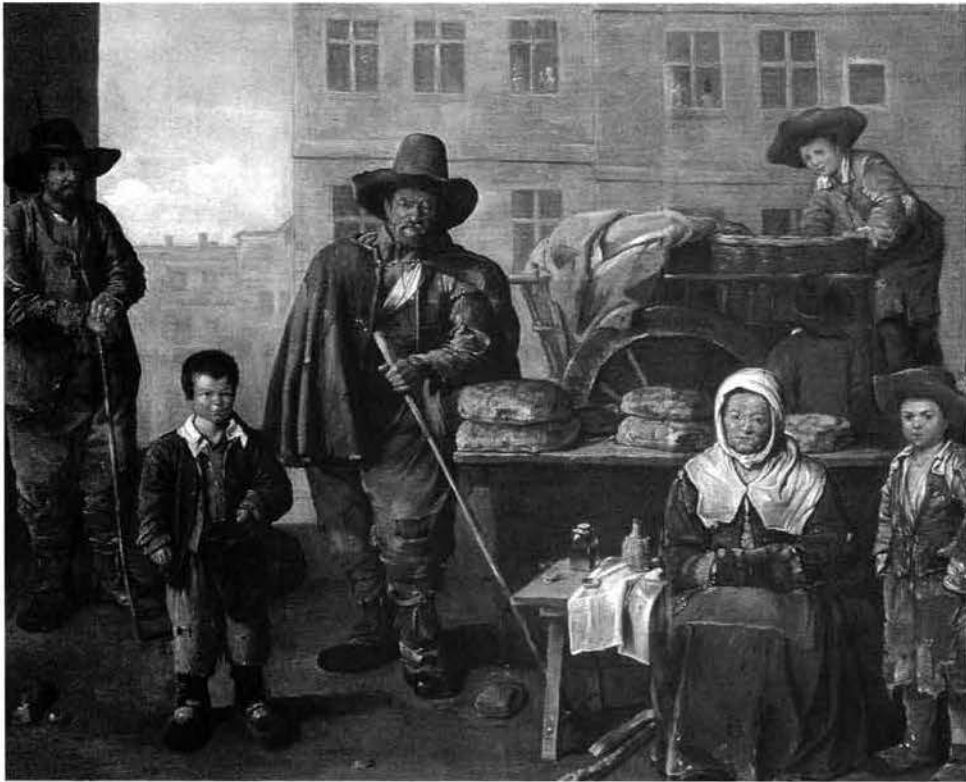
« Pauvres, mais dignes - Tableau de Le Nain : la charrette du boulanger »

Malgré ces circonstances dramatiques, les décimateurs n'envoient que trente livres par an au curé pour « fournir le bouillon et l'entretien des pauvres les plus nécessiteux ». Les consuls se disent « outrés » et se demandent comment ces ecclésiastiques osent donner une si modeste somme comparée à l'importance des revenus qu'ils sortent de Blagnac », revenus qu'ils estiment à onze ou douze livres. Ils rappellent « qu'un tiers de la dîme doit être employé à l'entretien et à la nourriture des pauvres du lieu, l'autre tiers aux autels, ornements, vases sacrés, bougie et huile pour les lampes de l'église et le dernier tiers au propre entretien » des décimateurs. Au lieu de cela, selon les consuls « ils ont détourné ces revenus à leur profit, notamment pour un maître-autel ».