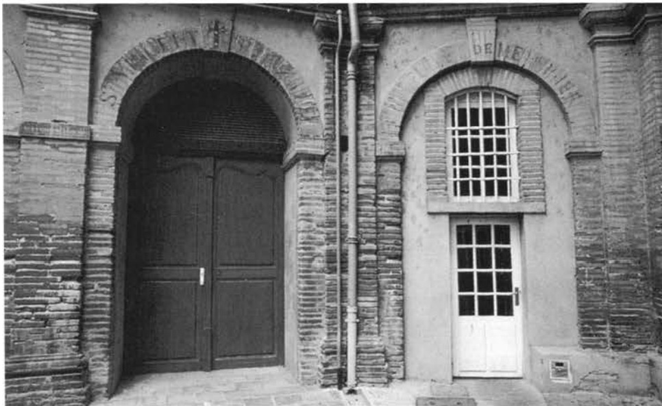
« A droite, la porte de l'atelier de menuiserie (l'inscription est à peine visible au-dessus) du dépôt de mendicité de La Grave »

Mais ceux qui mendient par paresse font peur car ils risquent de se livrer au vol ou à la prostitution, ils ne sont pas dignes d'être secou-