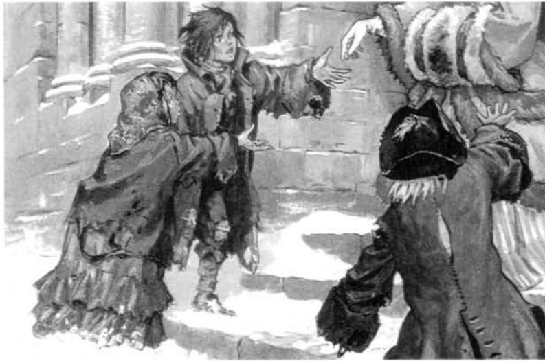
« L'hiver et les pauvres – par Pierre Joubert »

Vingt ans plus tard, en décembre 1853, la demande de crédit supplémentaire se justifie pour venir en aide aux pauvres sans travail et donc sans salaire, suite à l'abondance « de neige tombée dans la contrée ».