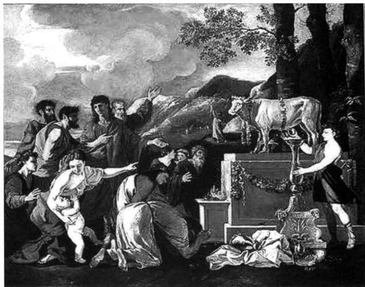
« Adoration du Veau D'or, par Nicolas POUSSIN »