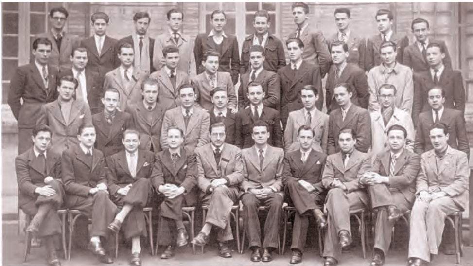
Classe de philo 1941-1942 Assis au premier rang, le 6 e en partant de la gauche, Jean-Pierre Vernant, professeur de philosophie.

A 17 ans, il adhère à l'Association Internationale des Athées Révolutionnaires, puis au Parti Communiste Français. Dans les années trente, tout en poursuivant ses études supérieures (il est reçu premier à l'agrégation de philosophie en 1937), il s'engage dans le combat antifasciste.