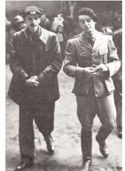
J-P Vernant en compagnie du professeur Meyerson, à la Libération.