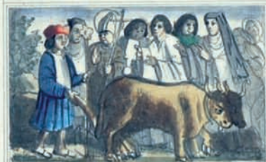
À Z L E B E N G E R S Q V E R E Z H L S C A P T