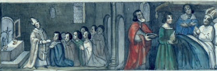
À I S V P E R I F X S I O R E S E B R E I L E S P O B L E