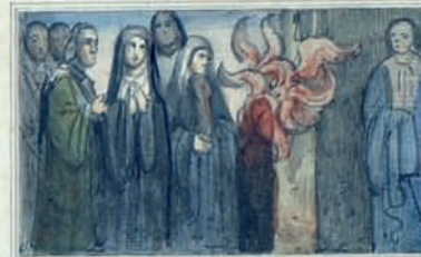
À L E S F O C Q F V T E S T I N T P S S V P E R I S