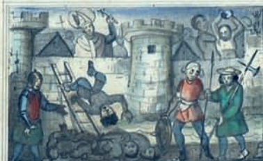
À G A R D E T H O L O S A D E P E R I F