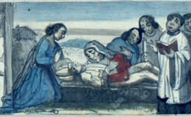
À S S V P E R I Z M O V R I T Z