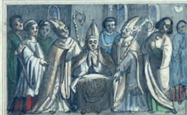
À S S V P E R I F V T F E I T F A R S E B E S Q V E