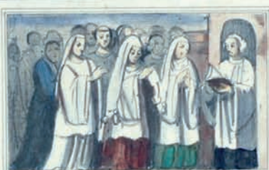
À LE S L E T I O N Q F V T F F A I T E S