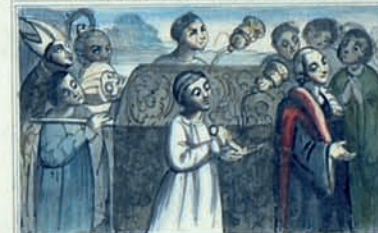
À L E S P O R T E R N A T S T O L O S T S