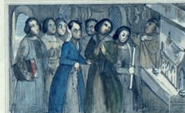
À P R E G A T I O N S S V P E R I S