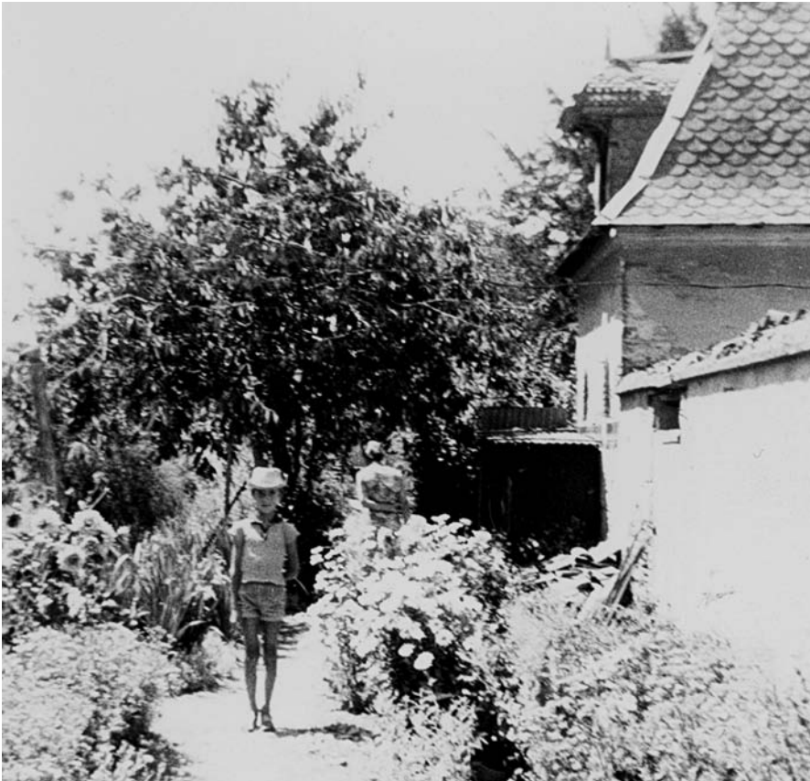
Un joli coin du jardin avec le pigeonnier existant encore.

Ces arguments se comprennent aisément, la France devant, avant tout, réparer les dommages causés par la guerre.