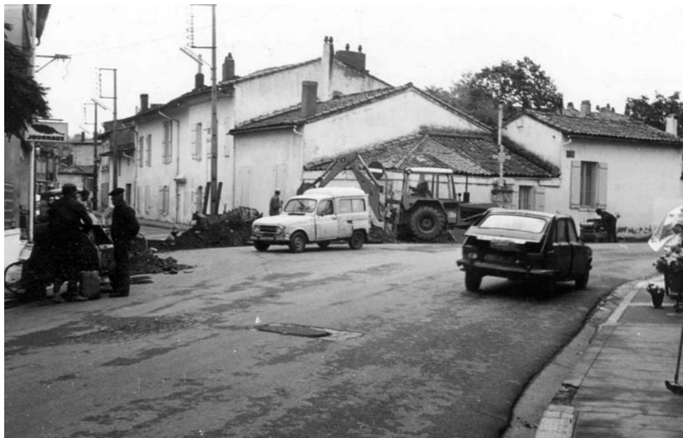
Lavoir, toilettes, douches et bureaux avant la démolition.

Après un échange de correspondance avec le Ministère de la Défense Nationale, la commune propose la construction de la gendarmerie sur un terrain lui appartenant. Le commandement de la Gendarmerie donne son accord, début juillet 1973 à condition « que la construction soit édifiée sur un terrain d'une superficie minimum de 4000 m 2 ».