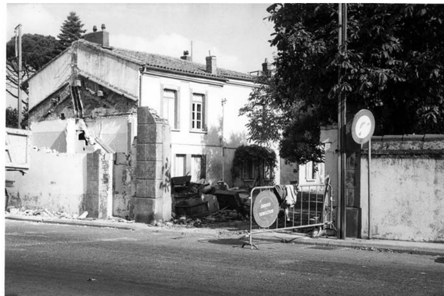
Travaux de démolition en 1977.

L'architecte Jean Montier signe les nouveaux plans. Après l'adjudication du 12 février 1976, approuvée en juin par le Préfet, les travaux commencent et s'achèvent en 1977 pour un coût total de 3 560 450 francs, avec une occupation effective à compter du 1 er août 1977.