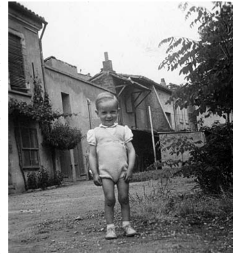
En arrière-plan, les bâtiments de la gendarmerie.

Pressentant une décision défavorable, le maire et les conseillers