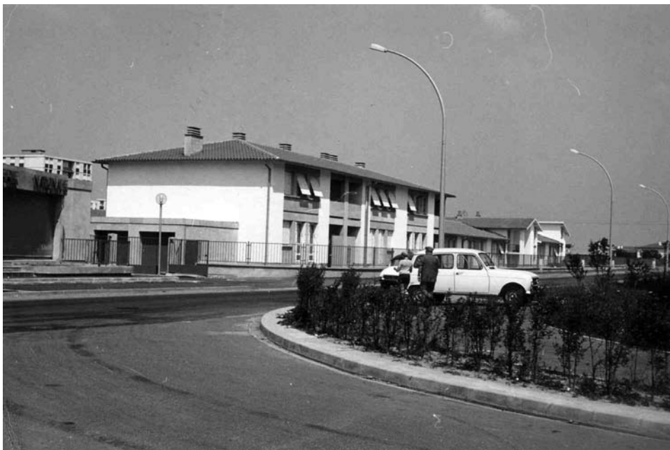
Vers 1979 : la nouvelle gendarmerie à gauche, les logements à droite.