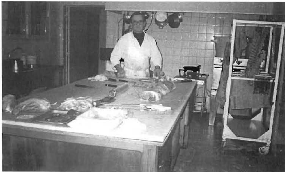
Une vue du laboratoire.