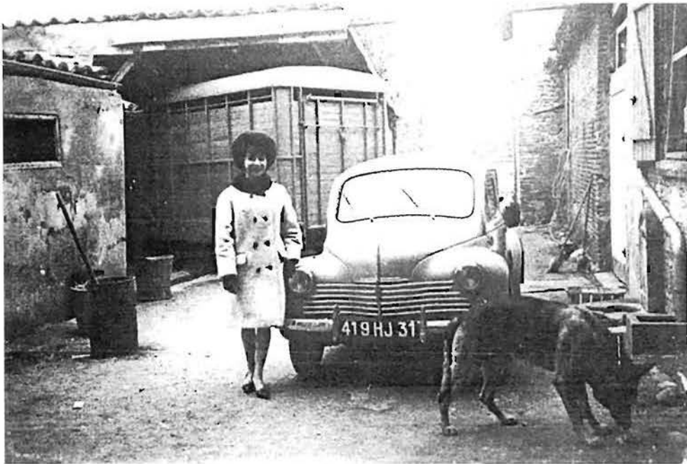
Dans la cour, derrière la boucherie : au fond à droite, l'écurie et à gauche, la bétailière.

pendues à des crochets, et aussi les abats. Si l'animal était sain, il délivrait un certificat et le garde-champêtre apposait l'estampille. Nous pouvions, seulement alors, transporter les carcasses avec le camion à la boucherie après les avoir coupées en quartiers pour les manipuler plus commodément. Mais que c'était pénible de porter sur l'épaule ces quartiers qui pesaient dans les 130 à 140 kg quand le camion était en panne !