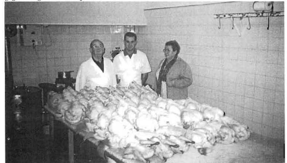
Les volailles sont prêtes pour la fête locale.

Autrefois, nous fermions le vendredi-saint car personne, ce jour-là, ne mangeait de la viande. Nous en profitions pour faire le « grand nettoyage » ! Aujourd'hui, la religion n'a plus d'influence sur nos ventes. Pourtant certaines traditions persistent : achat de volailles (dindes, chapons...) à Noël, gigot d'agneau à Pâques.