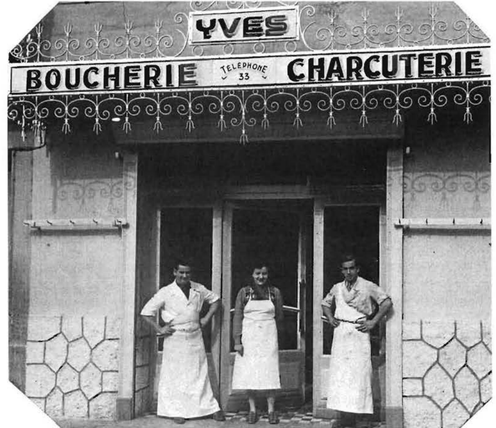
La boucherie dans les années 50. Les jours de fête, on accrochait des quartiers de viande aux crochets qui apparaissent sur le mur.

Très jeune, le métier de boucher me plaisait. J'ai fait l'apprentissage avec mon père. Ma mère s'occupait de la caisse.