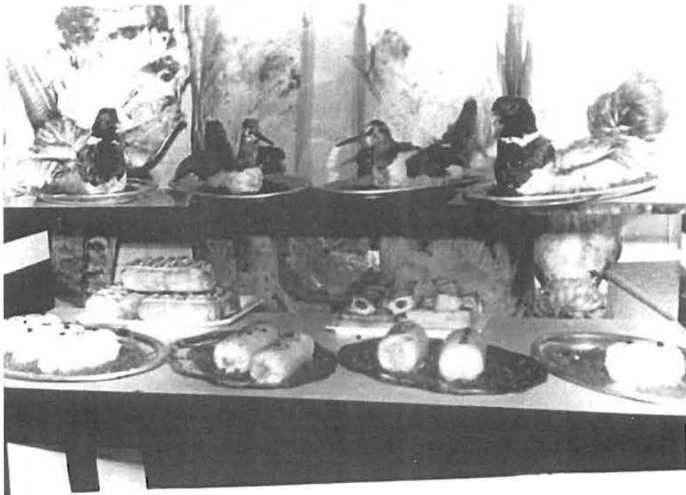
Décoration avec des plumes véritables aujourd'hui interdites.