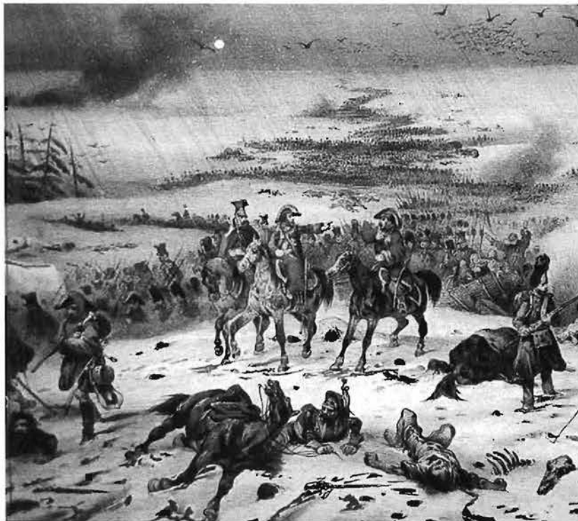
Épisode de la Retraite de Russie