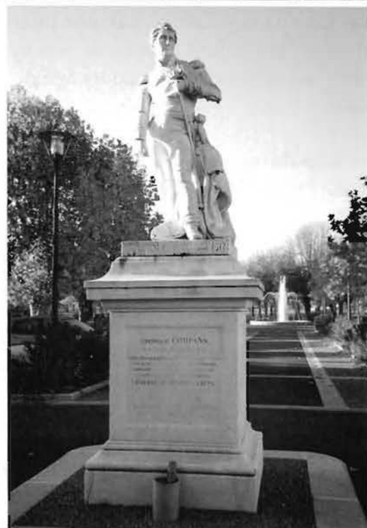
Remise de la gerbe à Salies-du-Salat