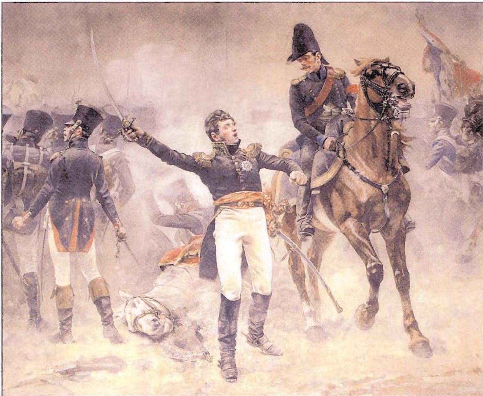
Le général Compans défendant la ville de Pantin, le 30 mars 1814.

Fragment d'une fresque murale de Schommer, située dans la salle de réceptions de l'hôtel de ville de Pantin.