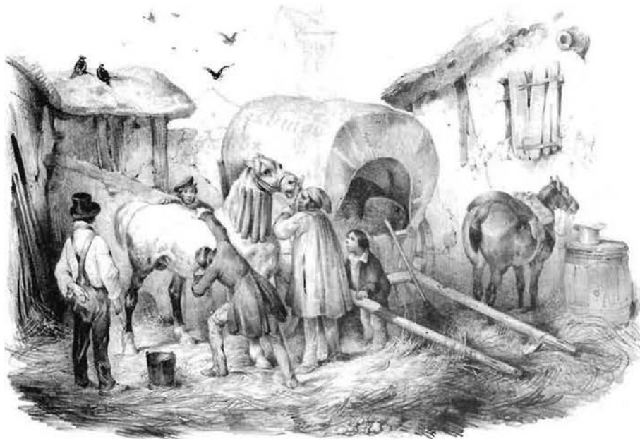
La visite du vétérinaire (Gravure de Victor Adam)

En mai 1882, une jument est atteinte de « la morve » (maladie des