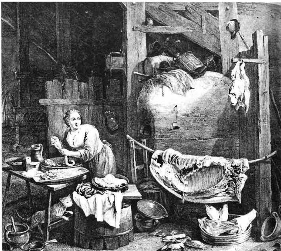
La fête du cochon (Gravure de J-P Le Bas)

La profession de boucher se transmet de génération en génération : de père en fils dans la famille Bosc, de beau-père à gendre chez les Sembres.