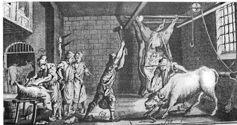
Un abattoir au XVIII e siècle