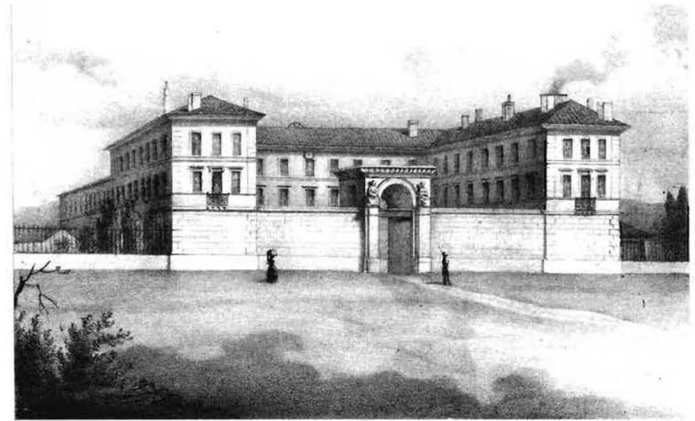
L'école vétérinaire de Toulouse (Toulouse monumentale et pittoresque - J.M. Cayla et C. Paul)

L'influence, sur notre santé et celle des animaux, de l'hygiène et de la propreté apparaît à cette époque (voir dans notre revue n°29, l'article sur les ordures).